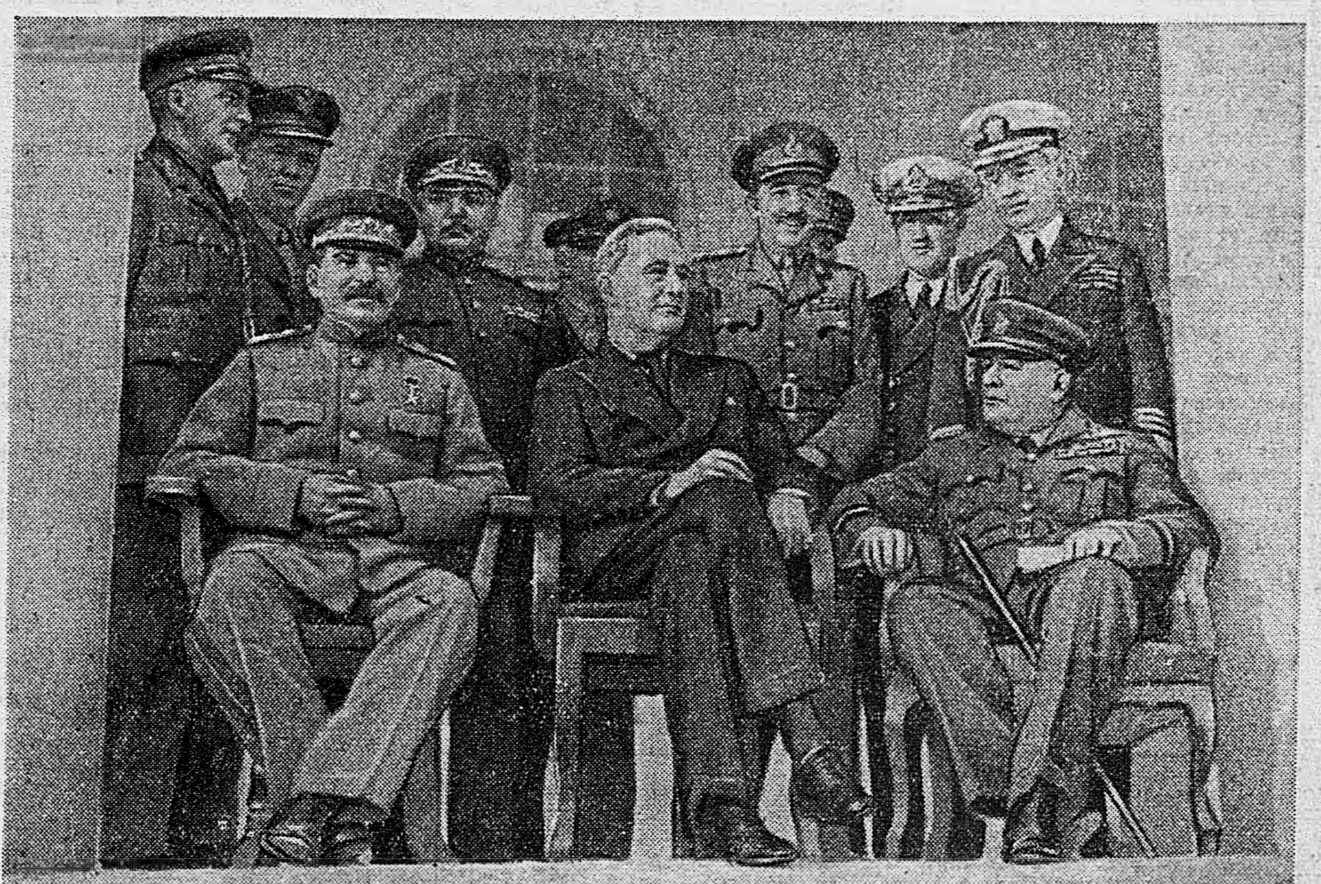
Конференция руководителей трех союзных держав — СССР, США и Великобритании в Тегеране. На снимке слева: И. В. Сталин, Ф. Д. Рузвельт, У. Черчилль. Стоят (слева направо) — фельдмаршал Д. Дилл, генерал Д. Маршалл, Маршал К. Е. Ворошилов, генерал А. Брук, адмирал Э. Кинг, адмирал У. Легг