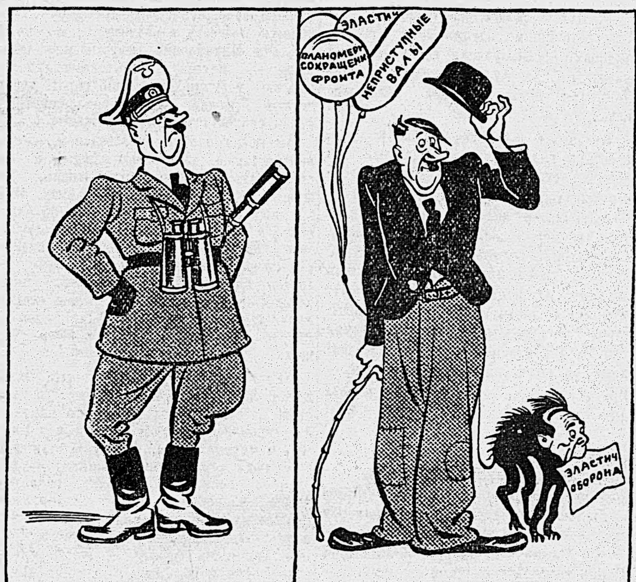
ЮРОР, он же по совместительству — ГЛАВНЫЙ ВОЕННЫЙ ЮМОРИСТ.

Для поднятия духа в гитлеровской армии созданы специальные должности «военных юмористов». (Из газет).