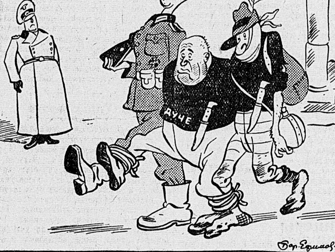
Смотр фашистской «добровольческой армии».

Немецкая печать заявляет, что новая «армия Муссолини» будет рекрутироваться из «добровольцев, готовых сражаться бок о бок с Германией».