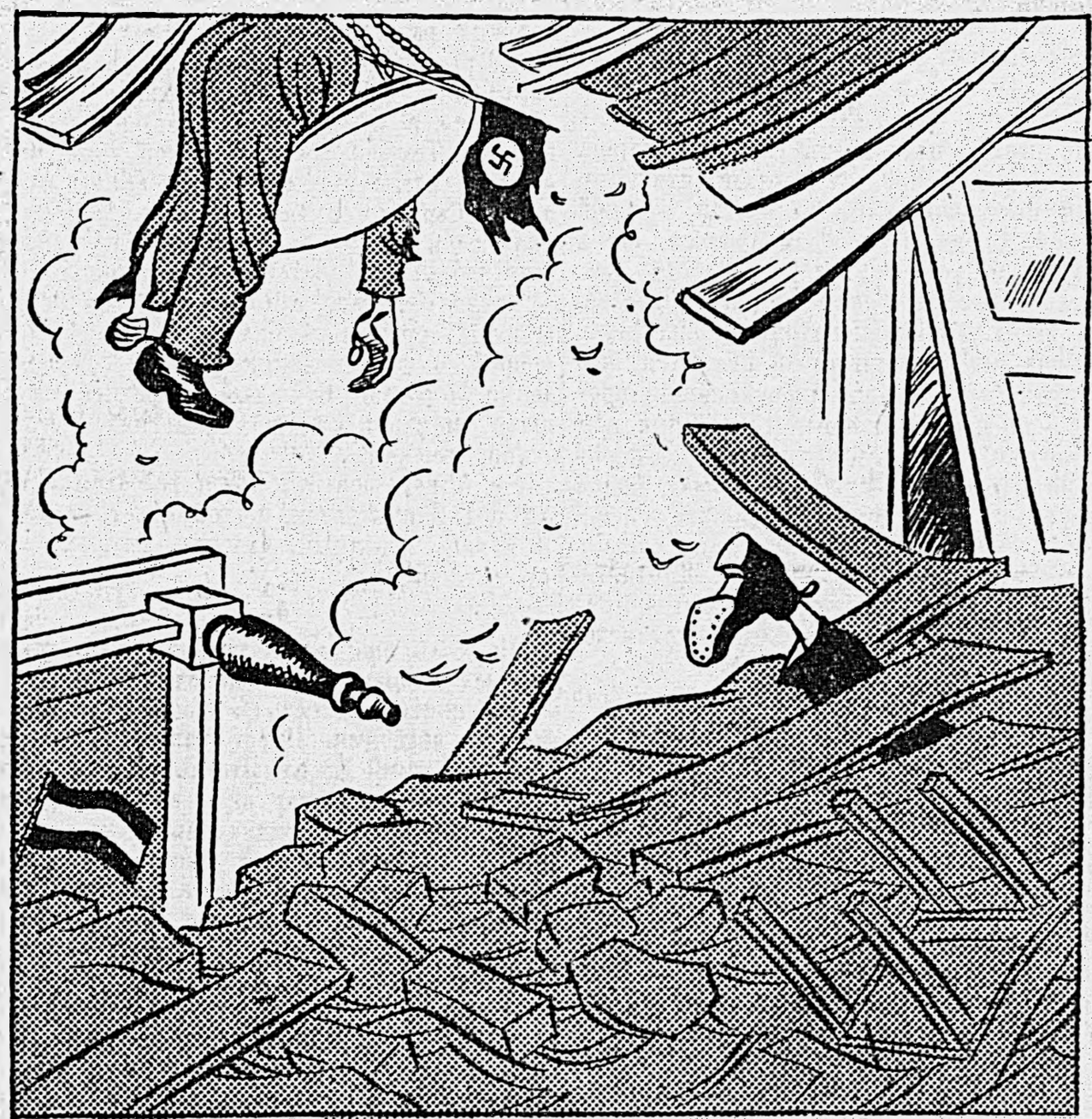
Виды на германо-венгерскую конференцию.