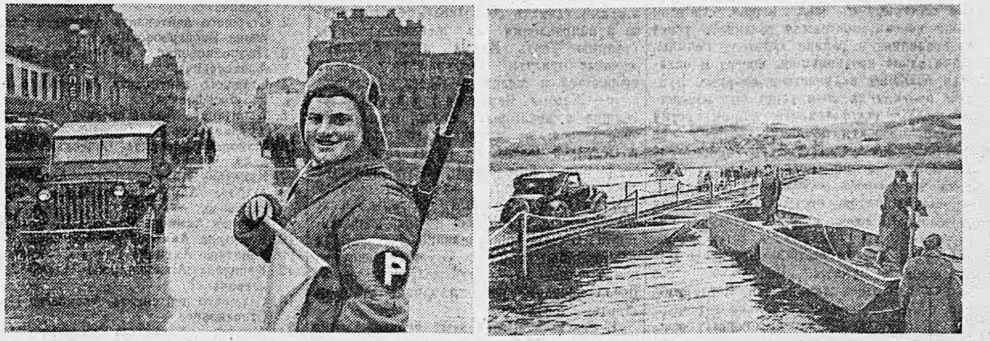
СЕГОДНЯ В КИЕВЕ. На снимках: 1. На улице Крещатик. 2. На мосту, наведенном нашими понтонерами через Днепр.