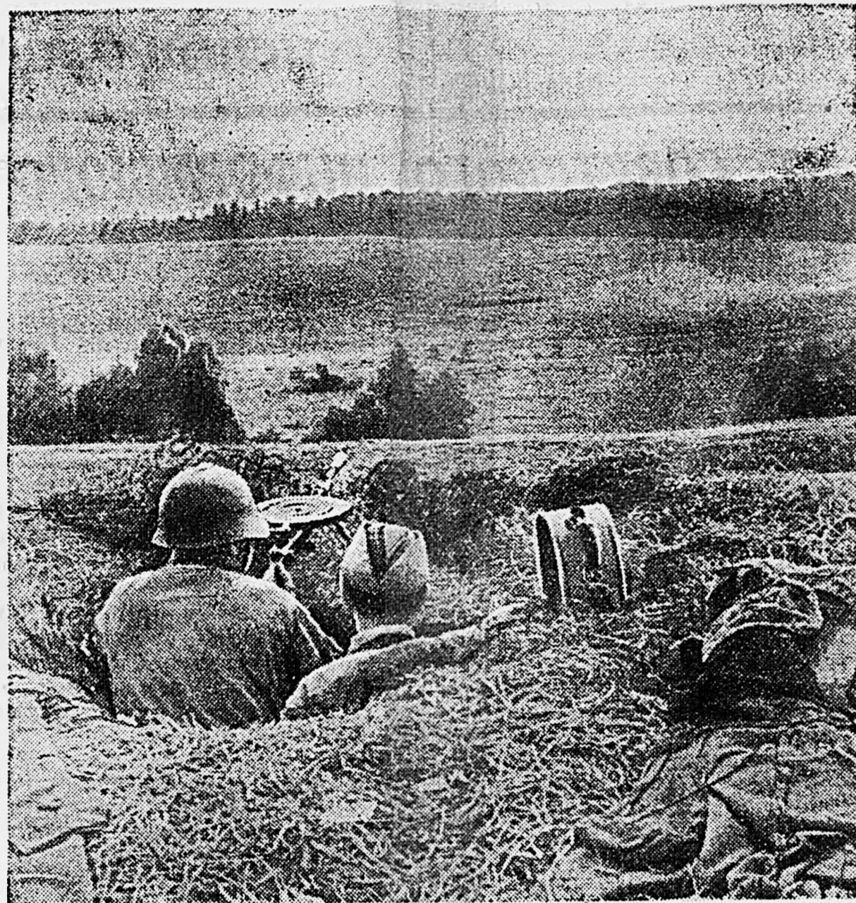
ЗАПАДНЫЙ ФРОНТ. Расчет ручного пулемета на огневой позиции.