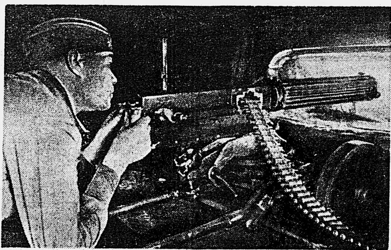
ДЕЙСТВУЮЩАЯ АРМИЯ. В лозе.

Разгадав замысел врага, командир батальона решил отогнать его пехоту от танков. Нашим артиллеристам, минометчикам и автоматчикам и на этот раз удалось прижать немецкую пехоту к земле. Прорвавшиеся танки были же в состоянии что-либо сделать с хорошо окапывающимися бойцами. Они вели беспорядочный огонь по шалям и потеряв восемь машин попытались отойти обратно. Однако пехота врага, пользуясь численным превосходством, предприняла несколько атак. До конца