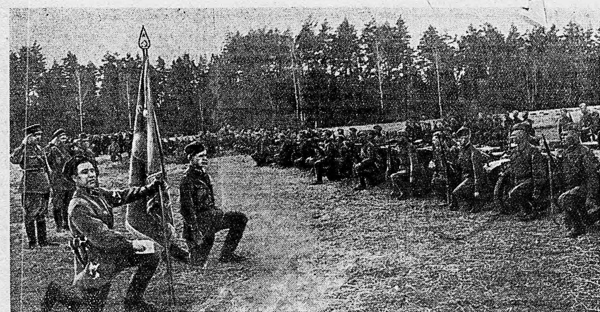
ДЕЙСТВУЮЩАЯ АРМИЯ. Вера в 1-ом Гвардейском Краснознаменном мотоциклетном полку состоялось вручение гвардейского знамени. На снимке: клятва гвардейцев.