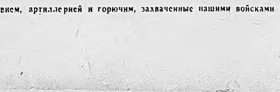
НА КУБАНИ. Немецкие эшелоны с боеприпасами, продовольствием, артиллерией и горючим, захваченные нашими войсками на одной из станций.