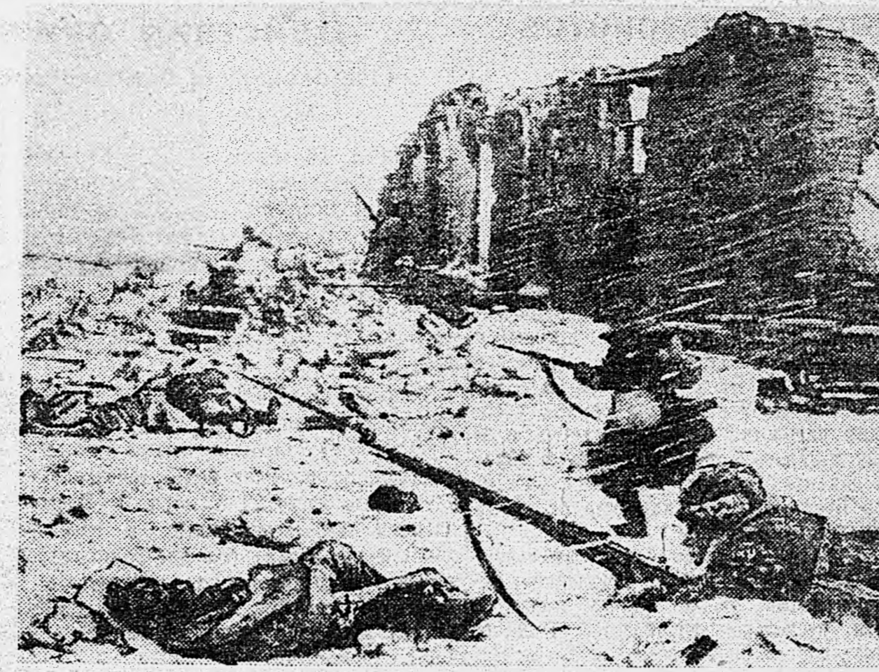
ДЕЙСТВУЮЩАЯ АРМИЯ. Бой на окраине населенного пункта.