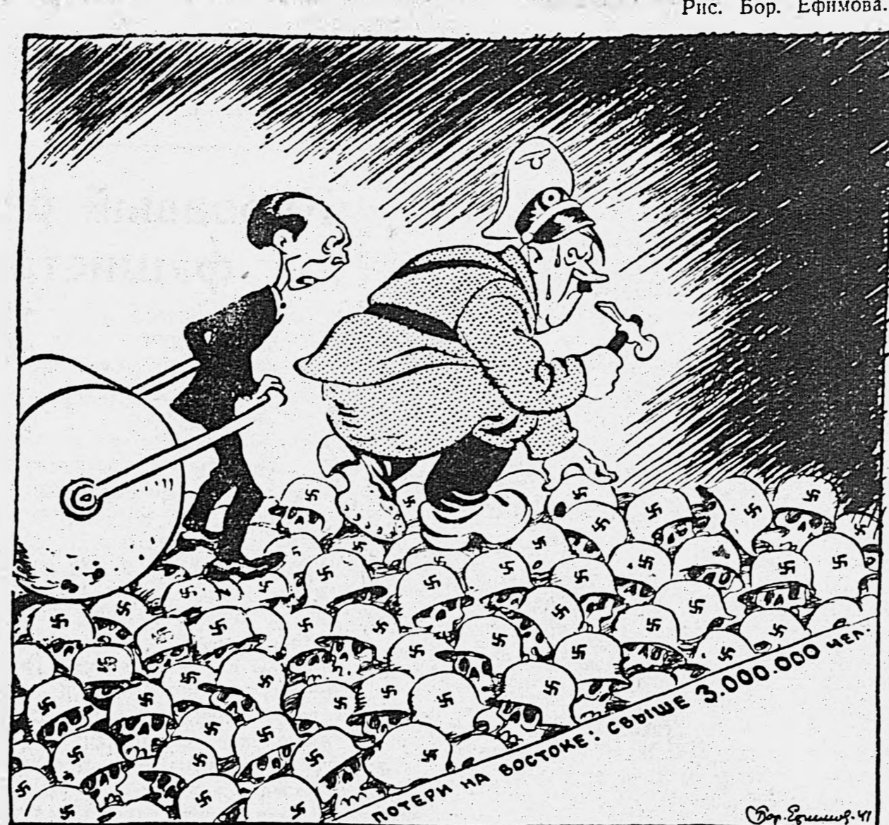
ГИТЛЕР: Доннерветтер! Этак нам, пожалуй, материала не хватит...