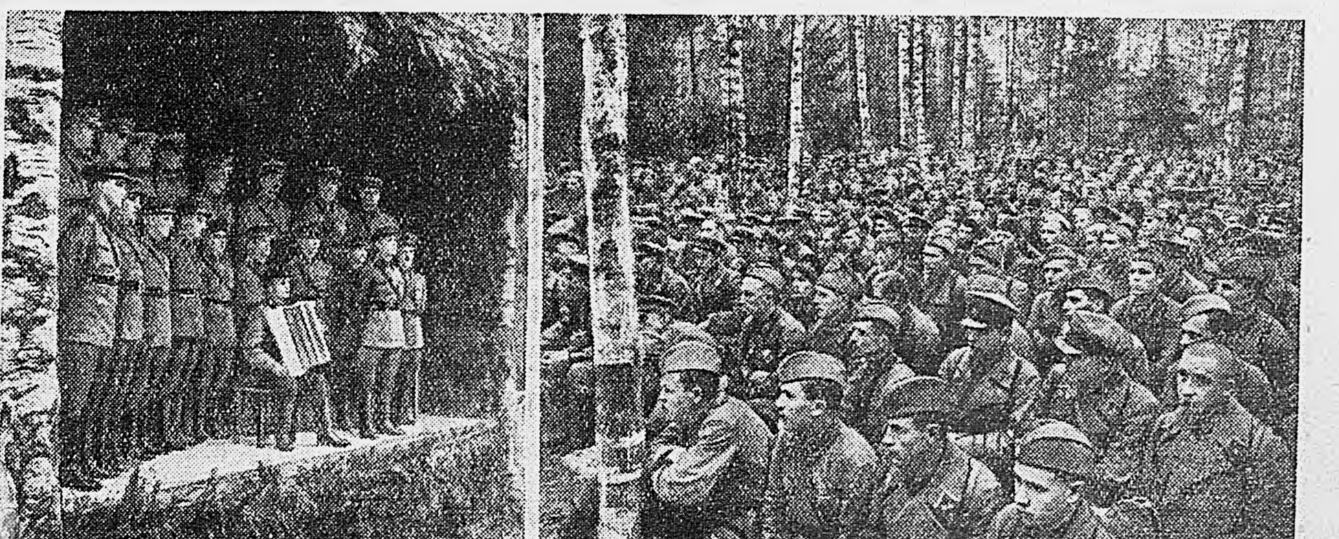
Действующая армия. В перерыве между боями бойцы и командиры Н-ской части слушают выступление красноармейского ансамбля.