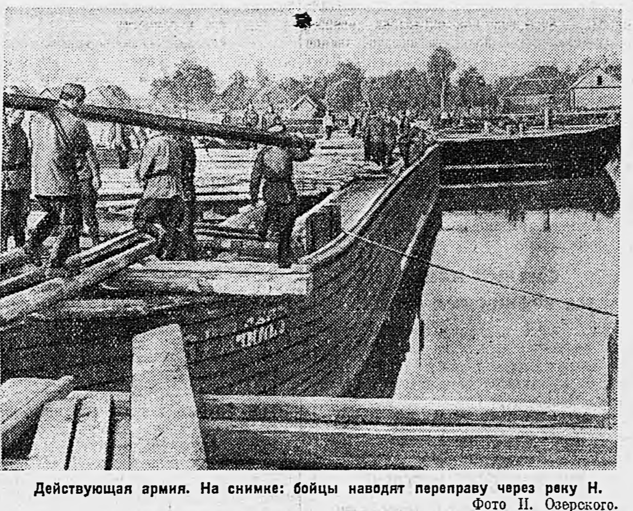
Действующая армия. На снимке: бойцы наводят переправу через реку Н.

танковой колонны были выставлены наблюдатели, что позволяло контролировать действия боевой порядков. Позже это уже невозможно было сделать, так как побитые машины загорались выходя из леса. К тому же недостаток горючего и большинства танков лишил их маневренности.