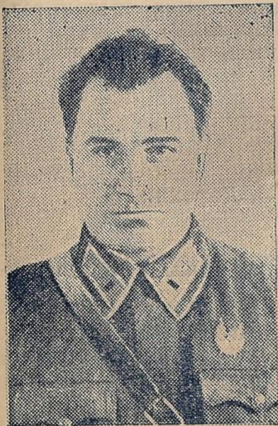
Герой отечественной войны капитан М. Постнов.

В памятные дни боев с белофиннами капитан Постнов проявил мужество и отвагу. Бесстрашный летчик тогда был помощником командира подразделения. Удары, наносимые белофиннам летчиками его подразделения, содействовали продвижению наших наземных частей.