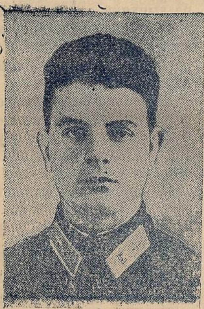
Герой отечественной войны летчик Топольский

Тишину нарушил треск ракеты. Летчики в миг оказались в кабинах. Еще несколько мгновений и самолеты отрываются от земли.