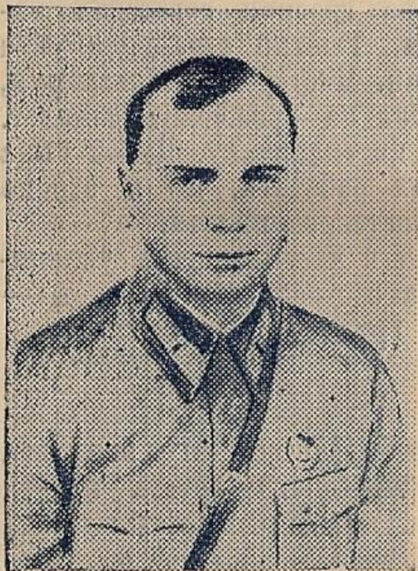
Герой отечественной войны ст. политрук Г. Хохлов

С ВИНЦОВЫЕ тучи нависли над полноводным Днестром. В его бархатно-зеленые берега упираются железобетонные устои Бендерского моста.