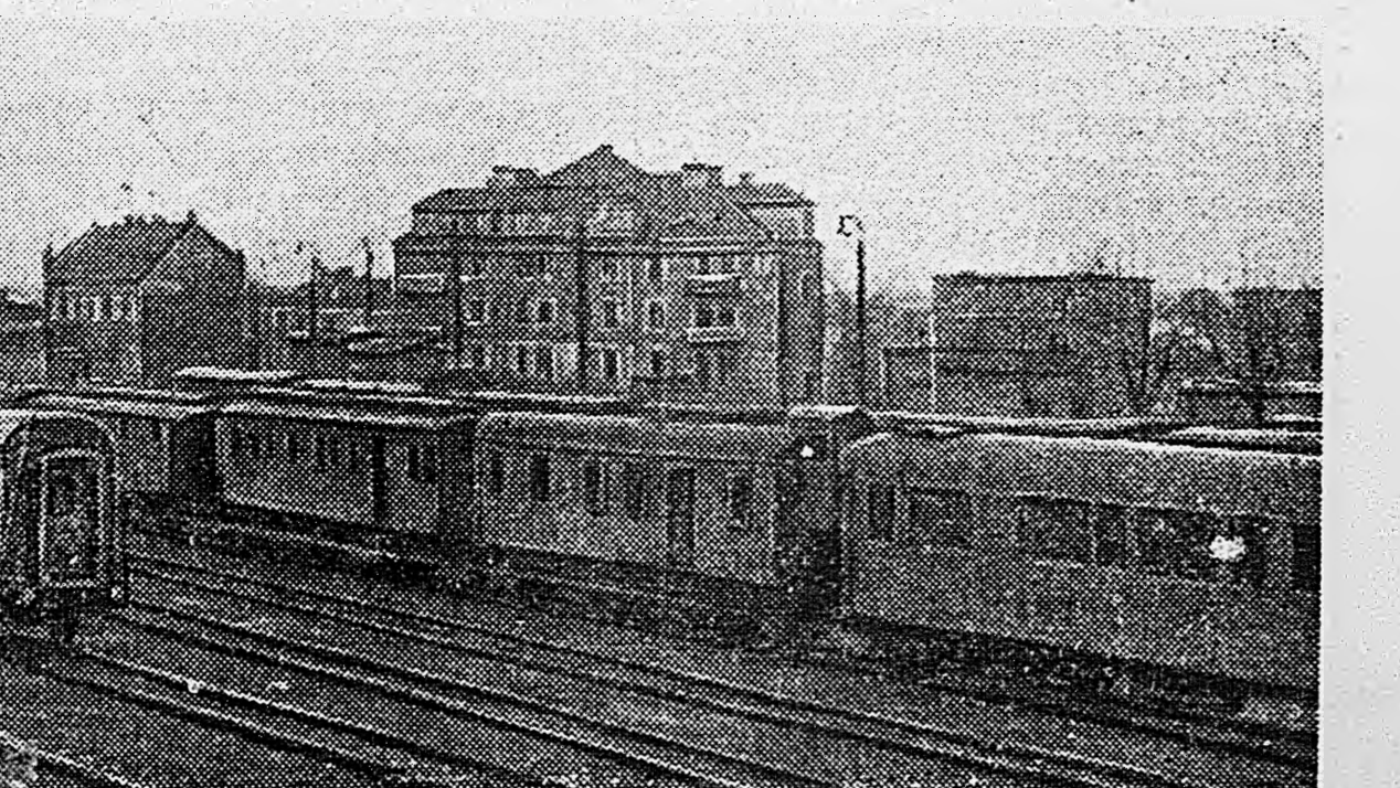
В РАЙОНЕ ПОЗНАНИ. 1. Подбитый немецкий танк на одной из улиц города. 2. Железнодорожные составы, захваченные нашими частями.