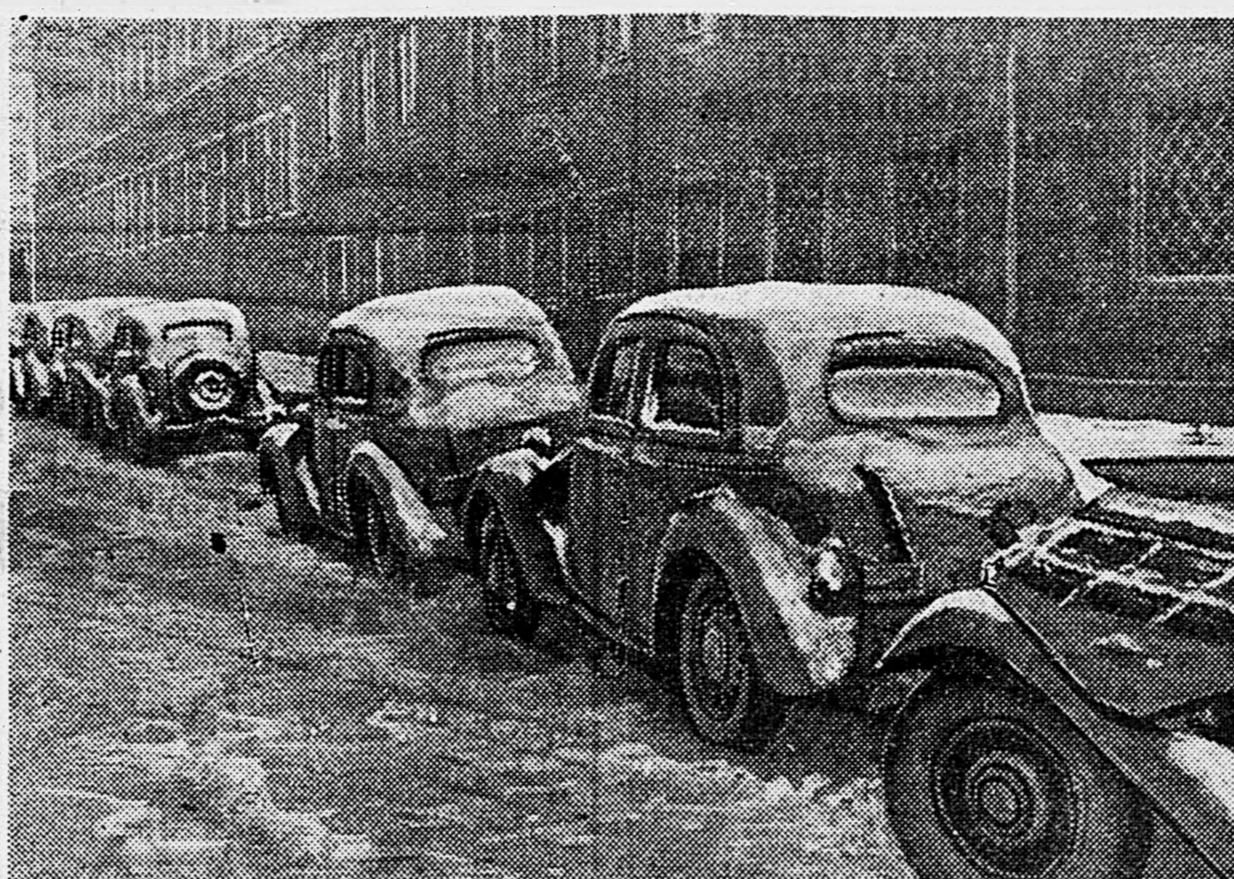
В НЕМЕЦКОЙ СИЛЕЗИИ. Автомшины противника, захваченные Н-ской частью.