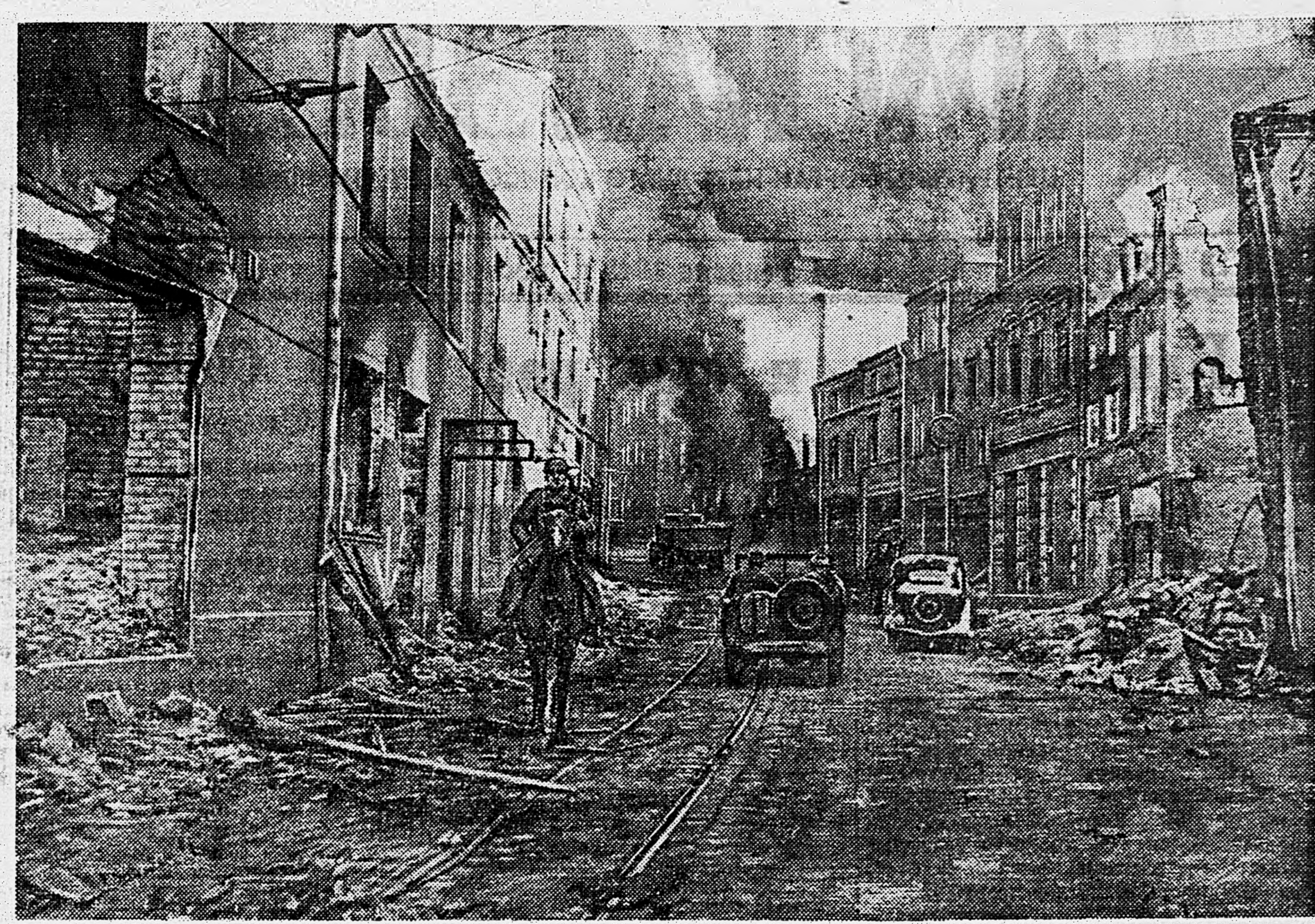
В ВОСТОЧНОЙ ПРУССИИ. Одна из улиц города Алленштайн, занятого нашими войсками.