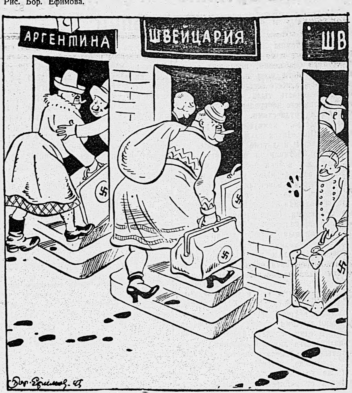
Бандит накануне прощанья с Берлином. Заносит добро по нейтральным «малинам», И банду склочивать будем сначала!