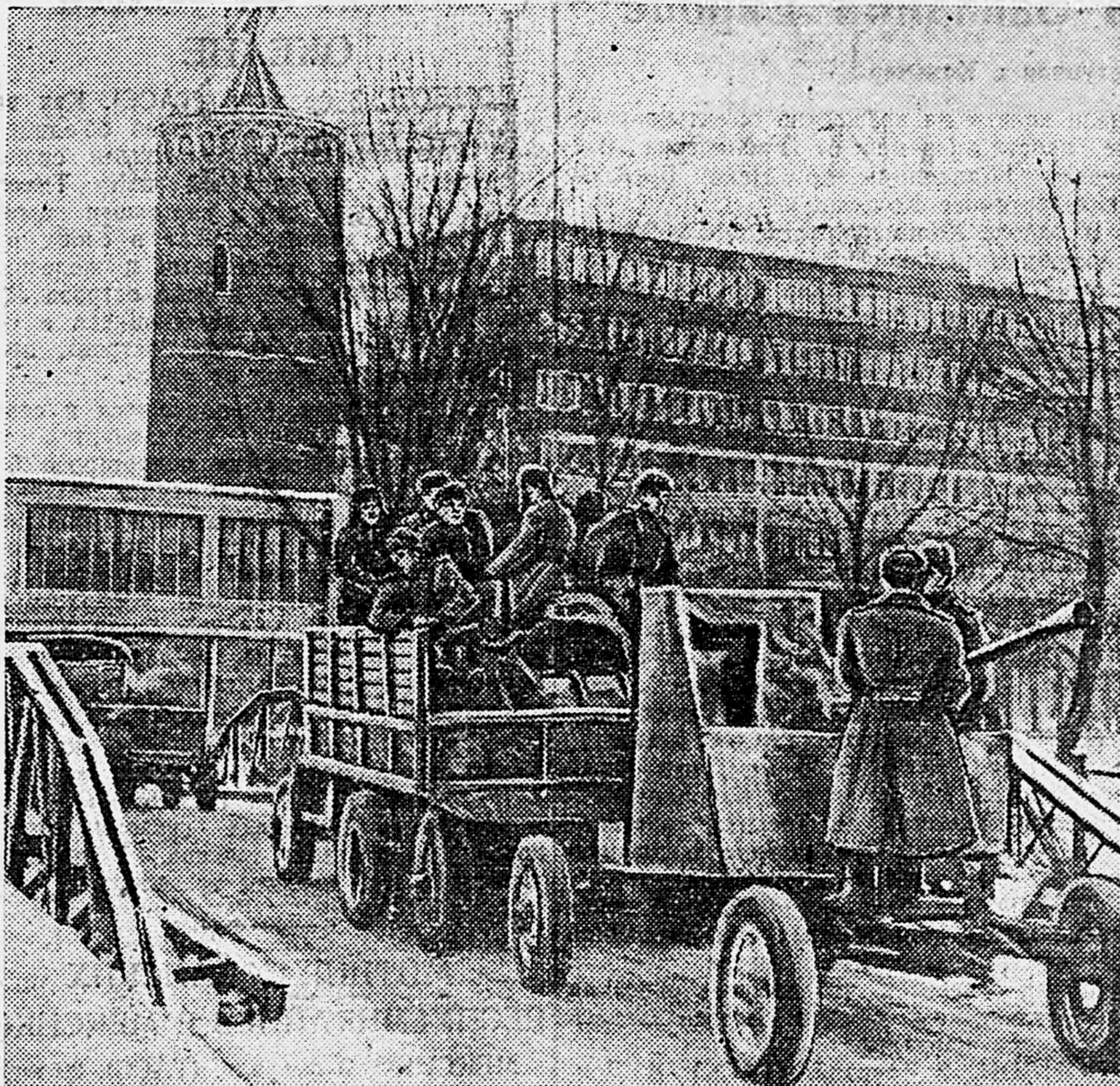
В НЕМЕЦКОЙ СИЛЕЗИИ. Артиллерийское подразделение проходит по мосту через канал.