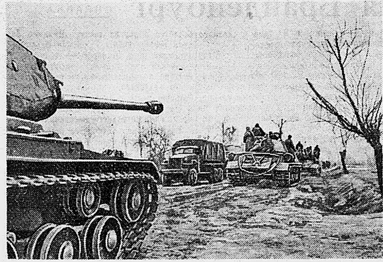
1-й БЕЛОРУССКИЙ ФРОНТ. Советские танки идут на запад.