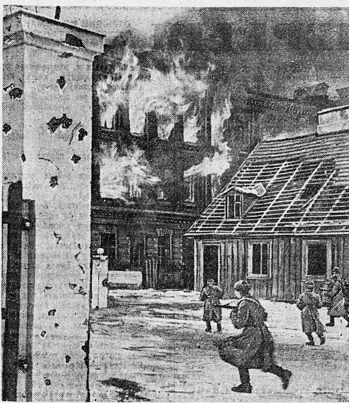
2-й БЕЛОРУССКИЙ ФРОНТ. Группа автоматчиков в уличном бою.

Снимался фильм при консультации полковника медицинской службы В. В. Гориневской и подполковника медицинской службы О. И. Эпштейна.