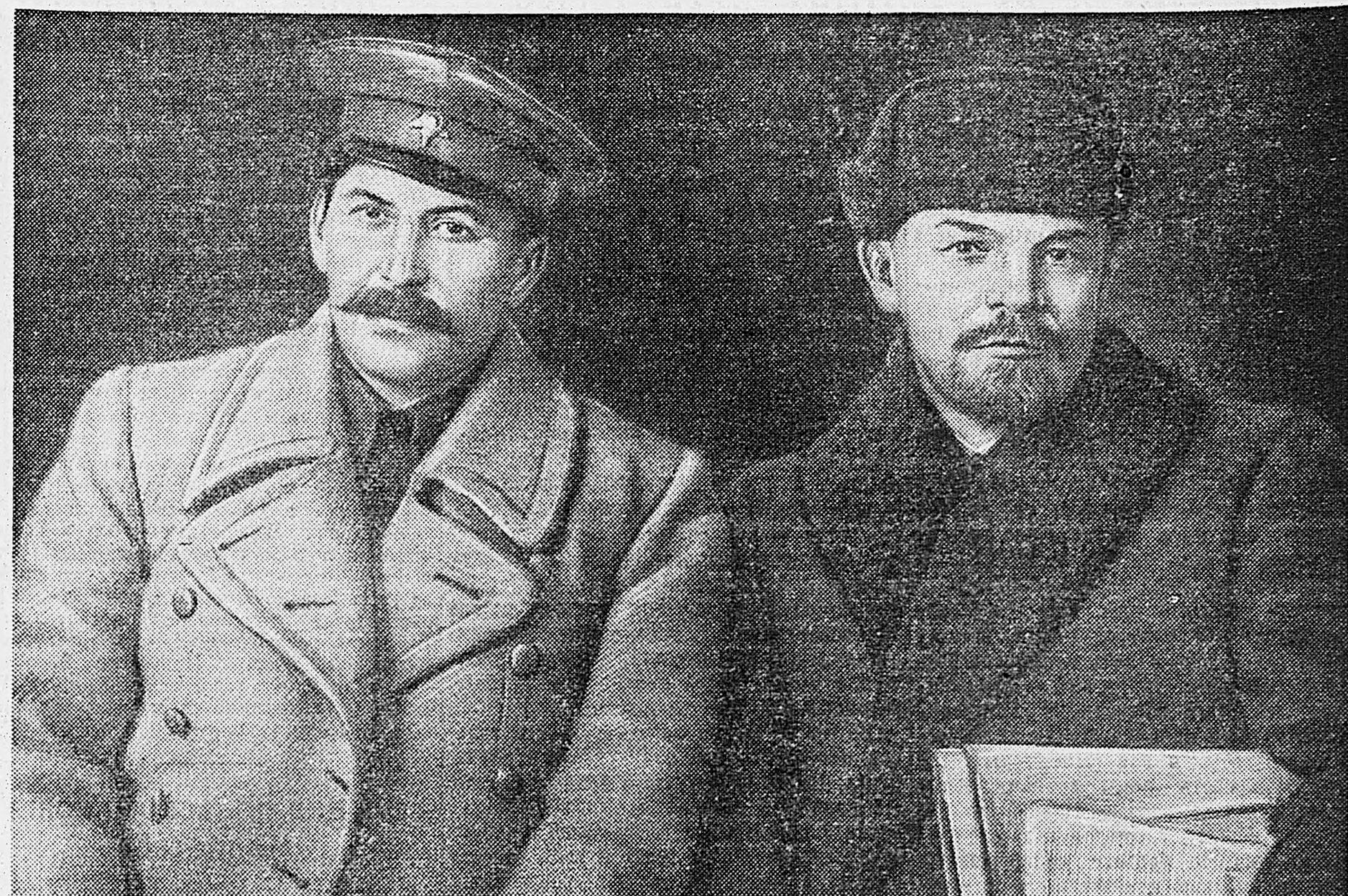
В. И. ЛЕНИН и И. В. СТАЛИН. (Снимок сделан во время VIII съезда партии, в 1919 году).

Создана Лениным и Сталиным Советская держава находится в авангарде борьбы свободных народов мира против фашистского варварства. Наша советская социалистическая страна, наш народ, наша Красная Армия спасли цивилизацию Европы от фашистского порабощения. Под непобедимым знаменем Ленина — Сталина Красная Армия навсегда изгнала немецко-фашистских захватчиков с советской земли и нанесла гитлеровской Германии новое и новое решительное поражение, прокладывая путь к окончательной победе.