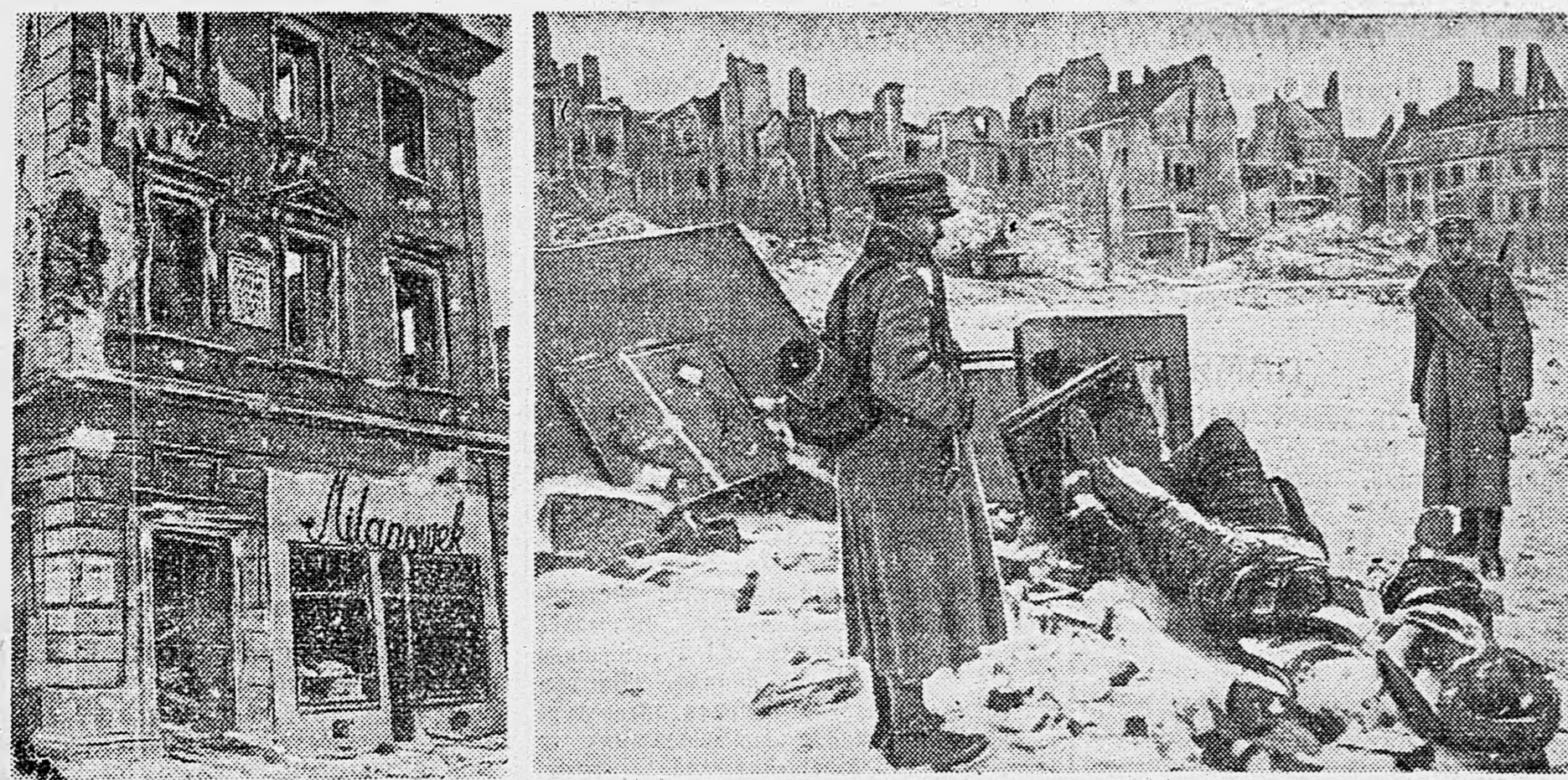
В ВАРШАВЕ. 1. Разрушенное здание, на котором сохранилась мемориальная доска с надписью: «В этом доме жил и творил Фредерик Шопен». 2. Польские солдаты у сбитой немцами колонны Сигизмунда III.