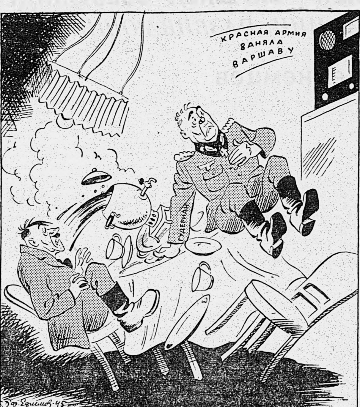
Рис. Бор. Ефимова.

К столу уселись выпить кофе. Взамен ликера и вина. Весть о варшавской катастрофе была им к кофе подана... Их снова быт. И быт заправски! Их шпарят так, что свет не мил. Крутое КОФЕ ПО-ВАРШАВСКИ! Им маршал Жукот заварил! В. Дыховичный.