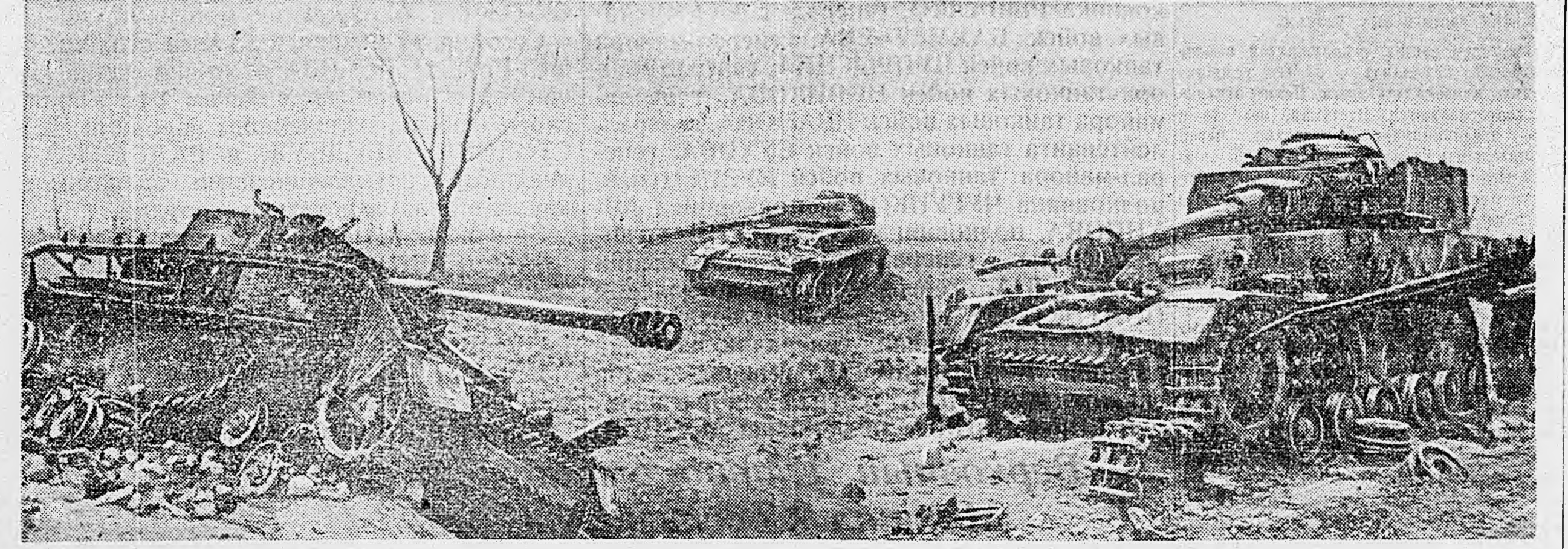
1-й БЕЛОРУССКИЙ ФРОНТ. Немецкие танки, разбитые нашей артиллерией под Варшавой.

Награждение орденами вызвало новый боевой пыл среди бойцов и офицеров. На состоявшихся митингах выступавшие давали клятву усилить удары по врагу.