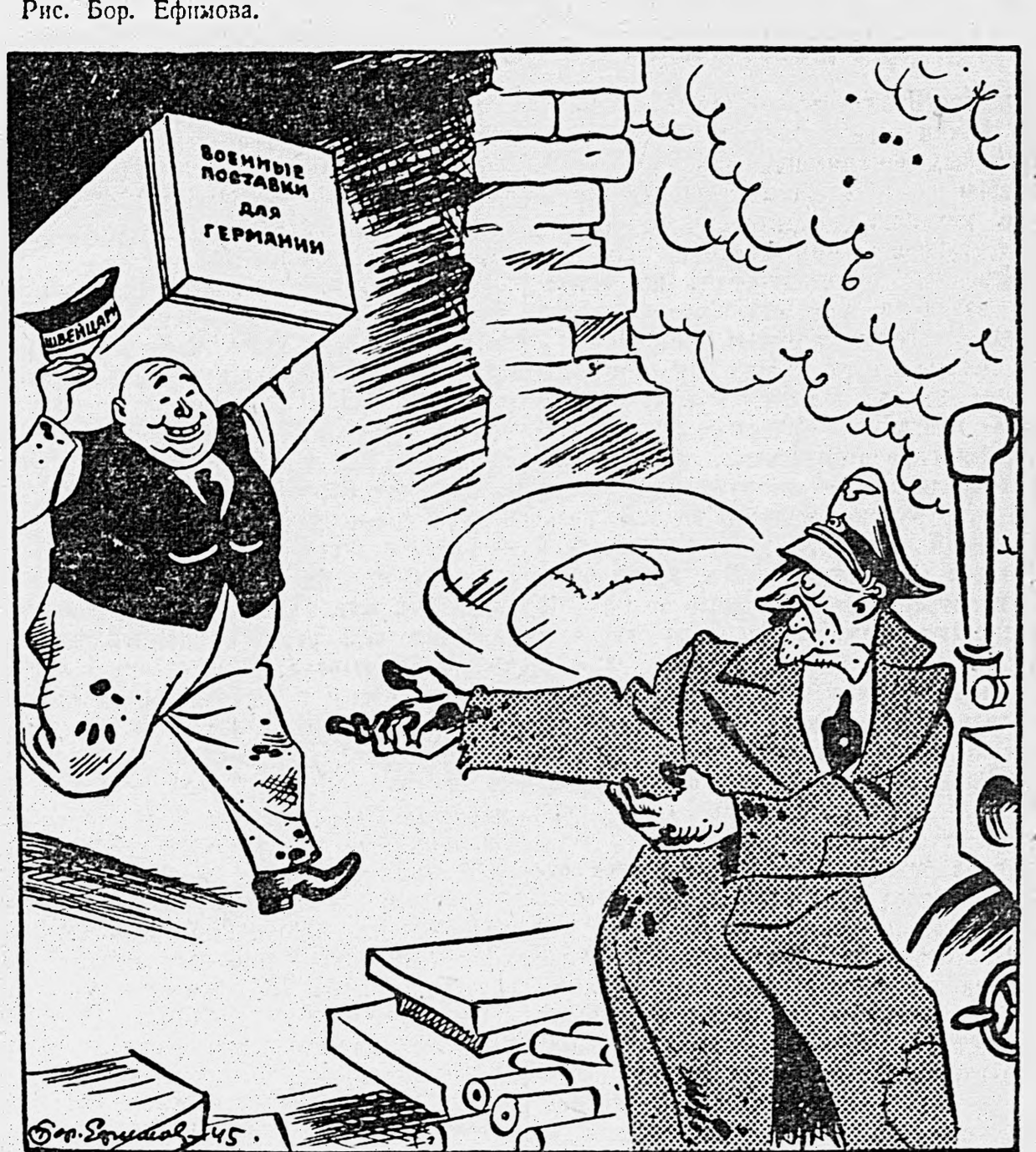
Оптовозничная торговля нейтралитетом и другими швейцарскими товарами. Доставка на-дом.

По сообщениям иностранной печати, Швейцария продолжает поставлять в Германию точные приборы, различную аппаратуру, машины и другие необходимые немцам товары.