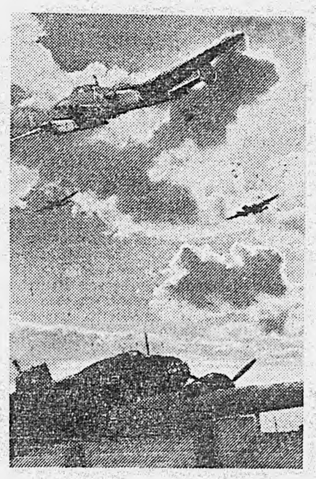
ДЕЙСТВУЮЩАЯ АРМИЯ. Пикирующие бомбардировщики отправляются на выполнение боевого задания.