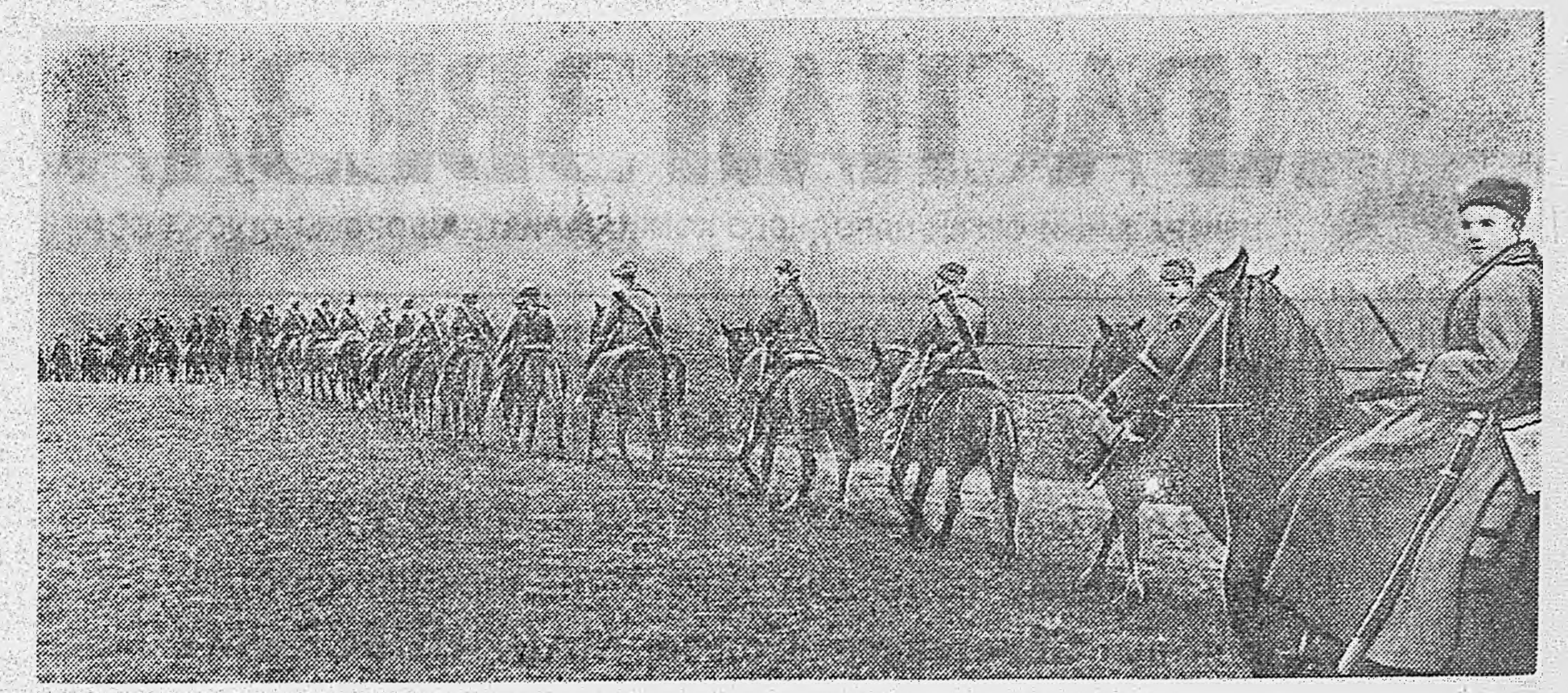
ДЕЙСТВУЮЩАЯ АРМИЯ. Н-ское кавалерийское подразделение на марше.