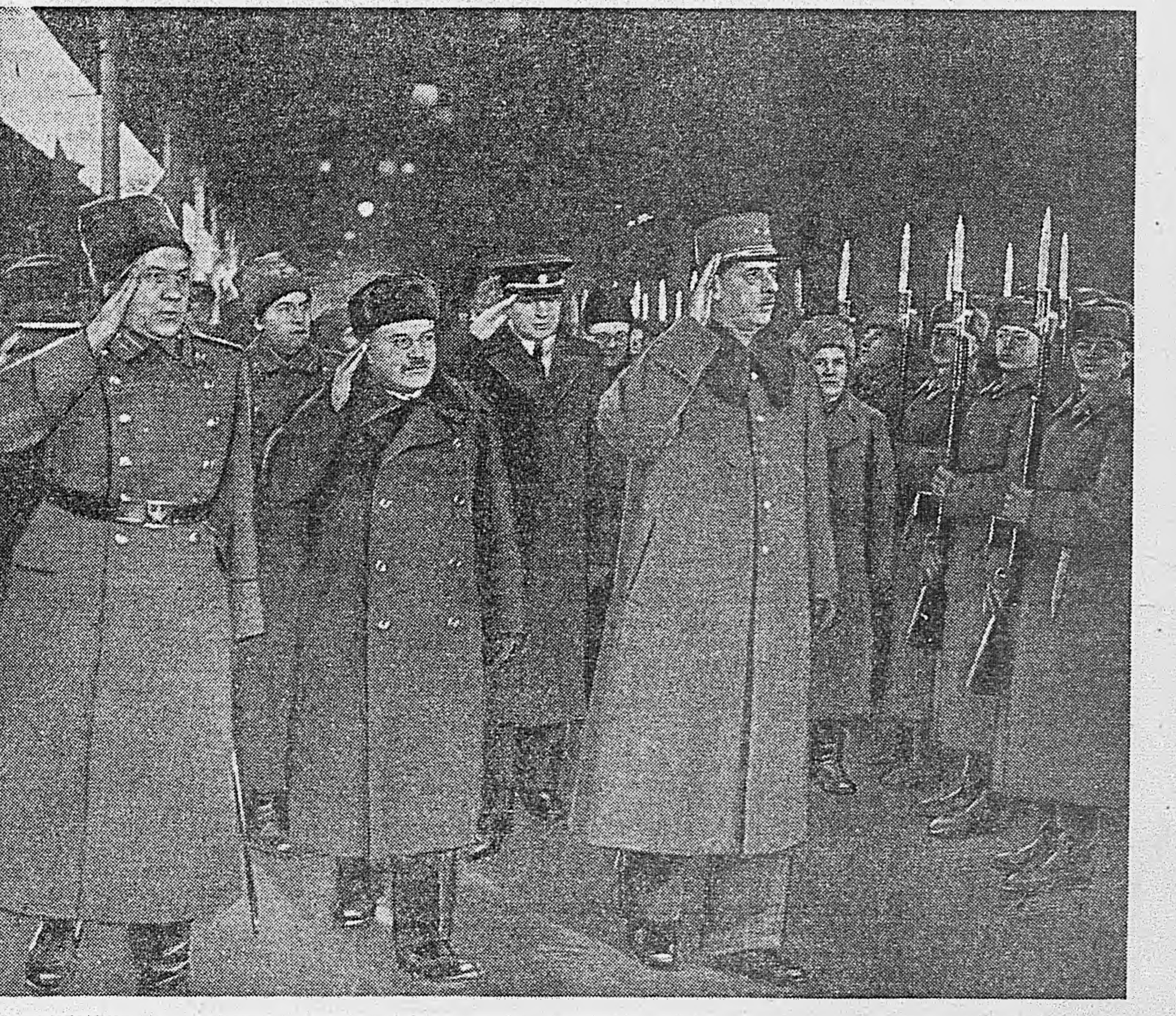
ПРИЕМЛЕ В МОСКВУ ГЛАВЫ ВРЕМЕННОГО ПРАВИТЕЛЬСТВА ФРАНЦУЗСКОЙ РЕСПУБЛИКИ ГЕНЕРАЛА ДЕ ГОЛЛЯ. На снимке: В. М. Молотов и генерал де Голль обходят фронт почетного караула.

В заключение пленный сообщил следующее: «Я бывший волаютелетс офицер воякскаго театра. Несколько дней тому назад я получил письмо из Веймара от моего учителя музыки, профессора Эварда Шульца. Он сообщил мне что в связи с провалом «сертотальной» мобилизации эвклет, воспринят известный лейбкеллер театр. Все актеры театра мобилизованы в армию. Руководитель театра Пауль Сикст и первый концертмейстер оркестра Гейбарт Кеккер назначены в артиллерию. За последние время в Германии ликвидированы все оркестры, а музыканты взяты в армию. Сейчас в Гельмштетте остался только один оркестр при берлинском радио».