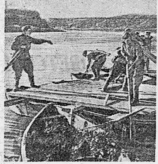
ДЕЙСТВУЮЩАЯ АРМИЯ. Бойцы наводят переправу.

Репорт подписали 580.330 чел. трудящихся Днепропетровской области.