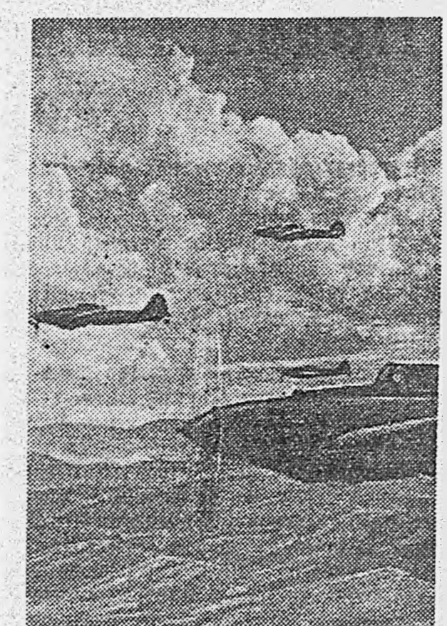
ДЕЙСТВУЮЩАЯ АРМИЯ. Штурмовики «Ил-2» над Карпатами. Снимок нашего фотожур. лейтенанта Ю. Скуратаца.

В этот напряженный момент, когда казалось, что штурм захлебнулся, там, внизу, в мутных подполках уже почти рассеялся туман, мелькнуло красное боевое знамя полка.