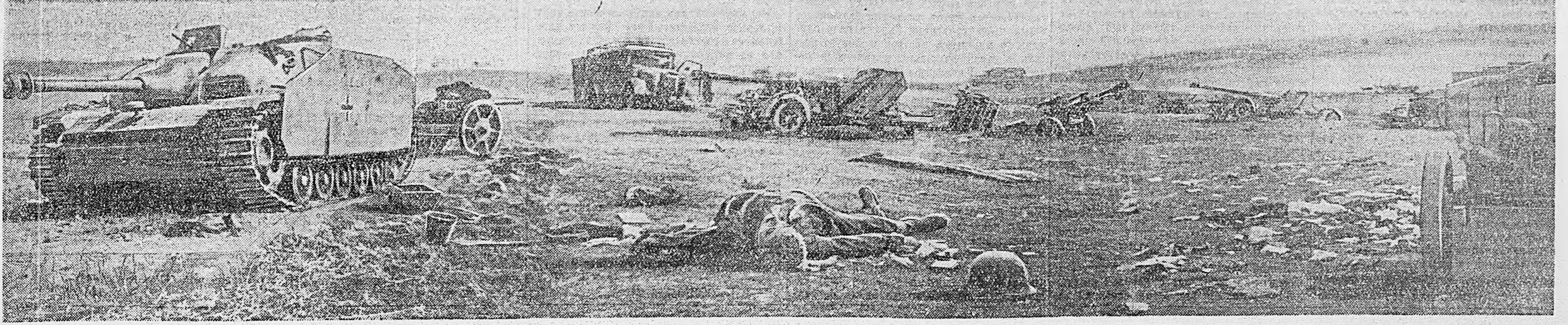
В РУМЫНИИ. Немецкая техника, разбитая и захваченная нашими войсками.

«Путь к Германии» и «Пакапуше». Первый очерк в свое время был напечатан в «Красной звезде», второй — в «Правде».