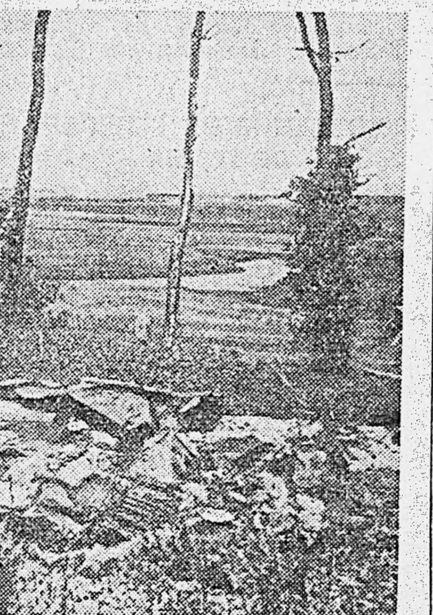
Вверху: 1. Саперы разминируют памятник и могилу Пушкина, заминированные немцами. 2. Внутренний вид Успенского собора Святогорского монастыря, взорванного и разрушенного немцами. Внизу: 1. Сожженные немцами здание Пушкинского музея в Михайловском. 2. Всё, что осталось от церкви в Тригорском, в которой Пушкин отслужил панихиду по английскому поэту Байрону.