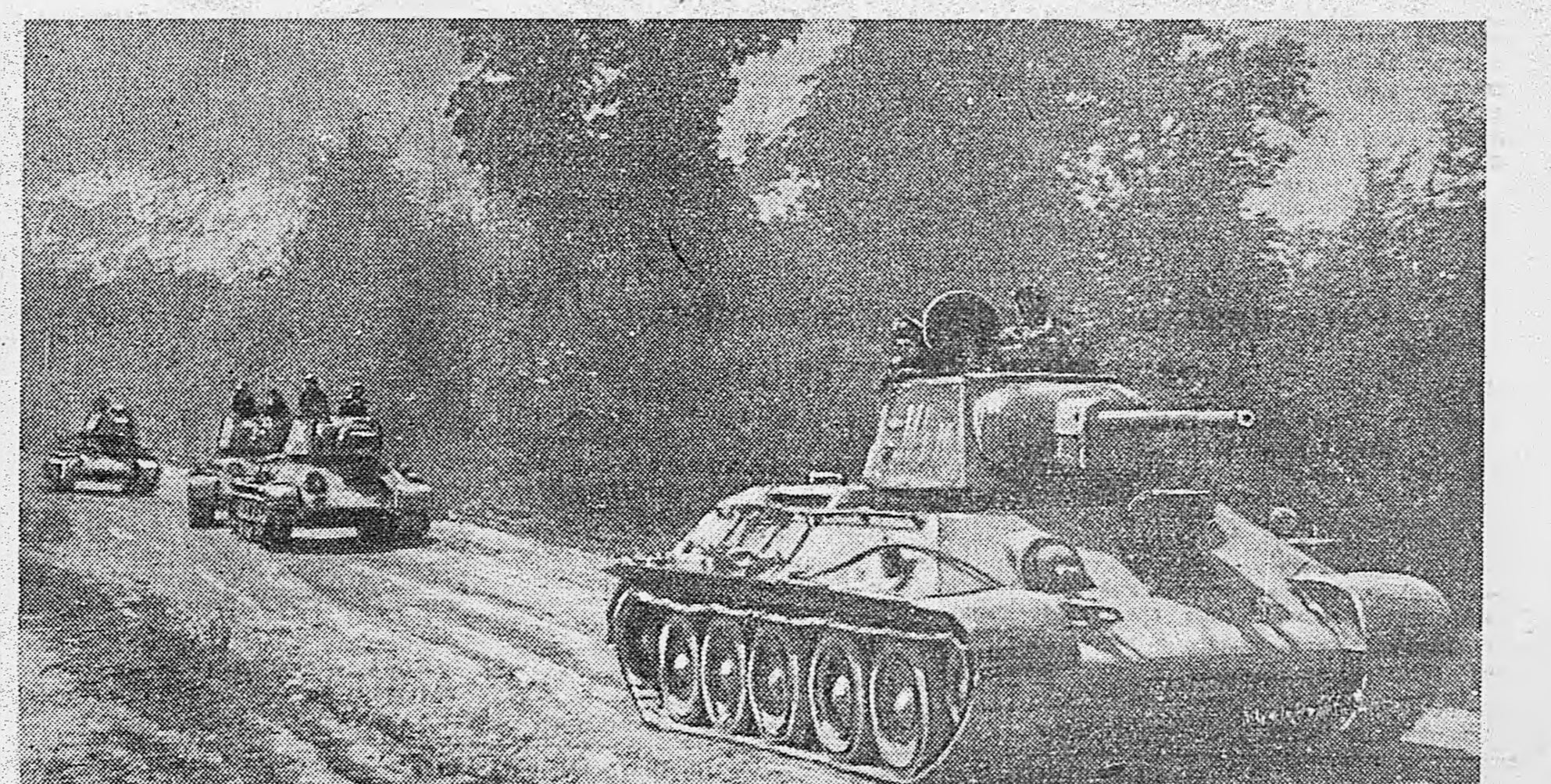
2-й УКРАИНСКИЙ ФРОНТ. В Румынии. Советские танки на марше.

Комитетом по делам архитектуры разработаны проекты жилых домов и хозяйственных построек для колхозов, совхозов и МТС в освобожденных районах. Новый тип жилого дома колхозника будет отличаться от старой постройки прежде всего своим удобством и рациональным расположением на усадьбе. Советское государство уже сейчас развернуло огромную работу по восстановлению городов и сел, освобожденных доблестной Красной Армией от немецких захватчиков. Мы сделаем всё для того, чтобы на освобожденной советской земле быстро выросли и расцвели новые, красивые и благоустроенные города и села.