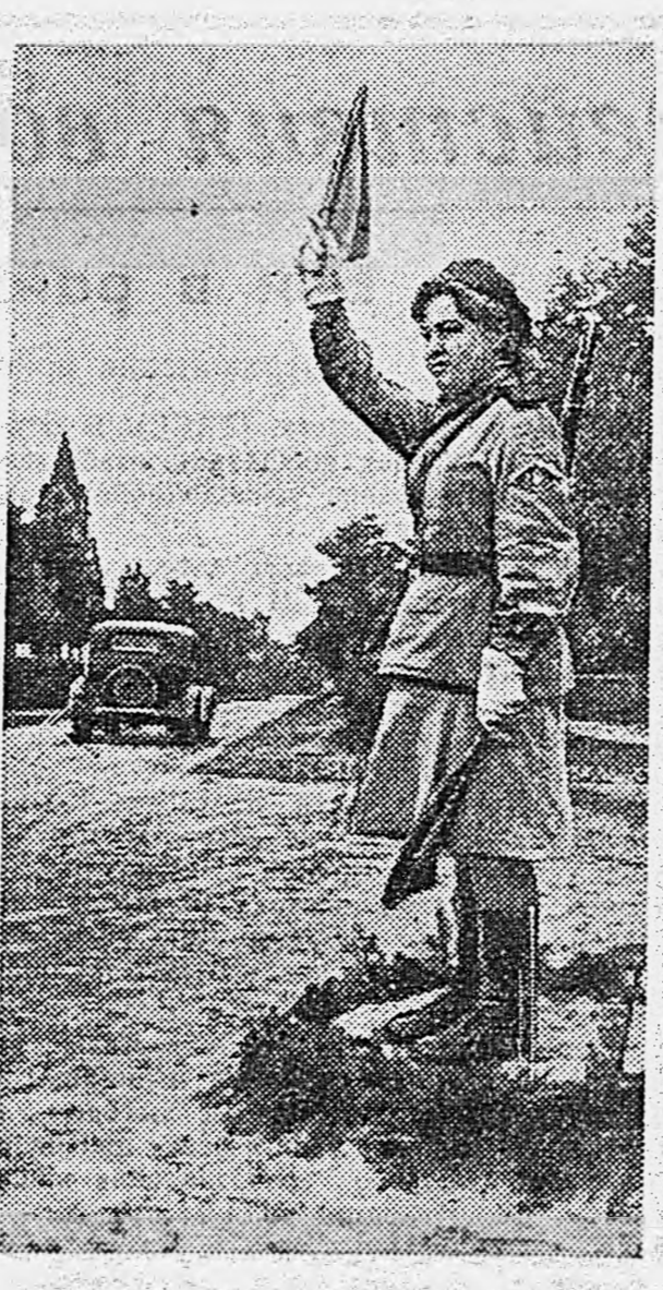
В ПОЛЬШЕ. Регулировщик-красноармеец на военной автомобильной дороге.

Несколько слов о глубине удара танков прорыва. Приведенные факты показывают, что их роль не ограничена на выломе тактической обороны противника.