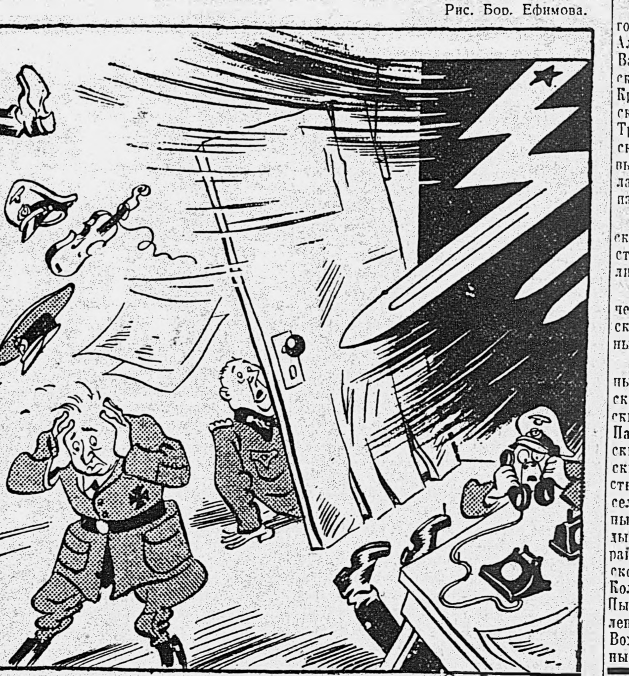
Гром с Ясного неба.