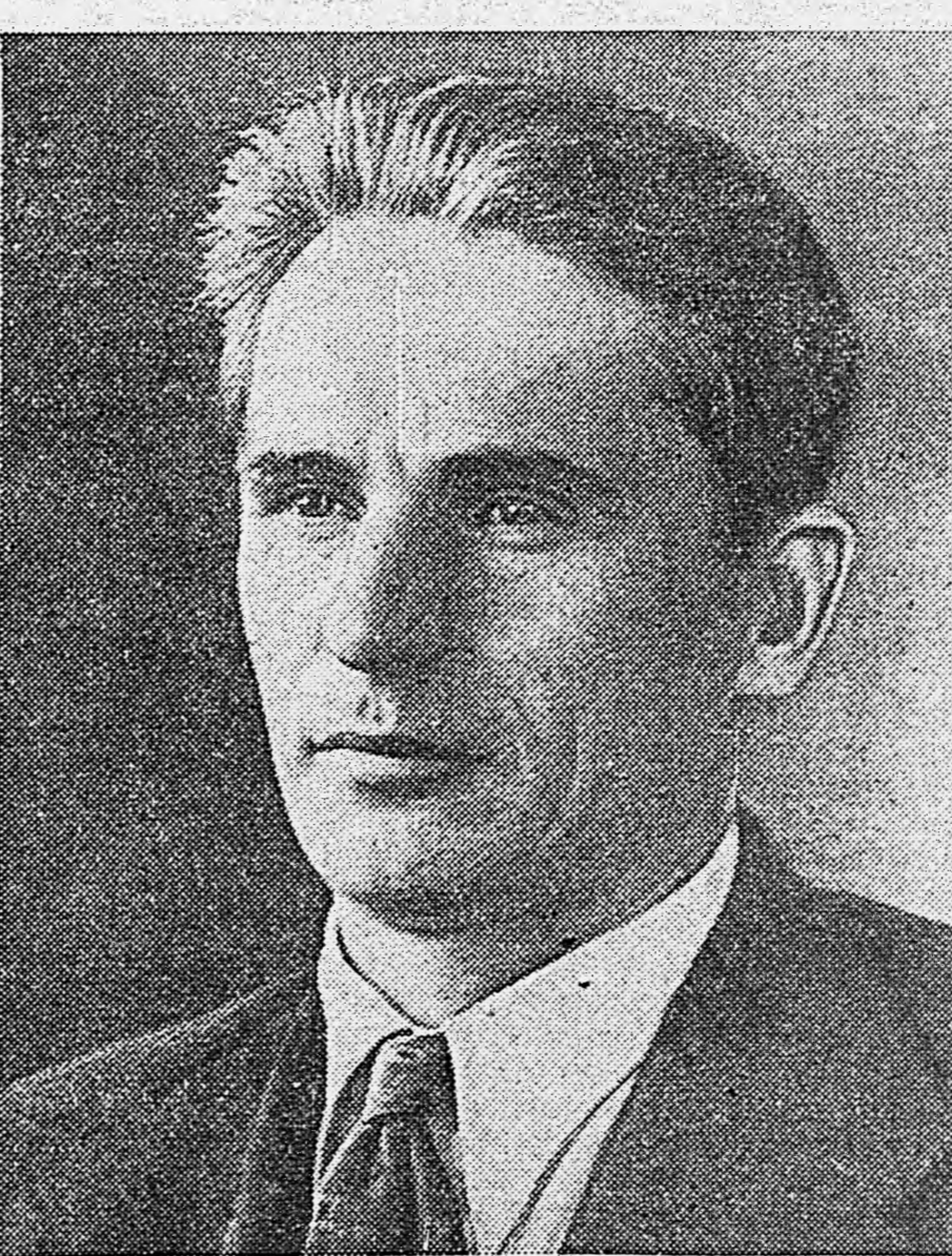
Председатель Польского Комитета Национального Освобождения г-н Э. Осубка-Моравский.