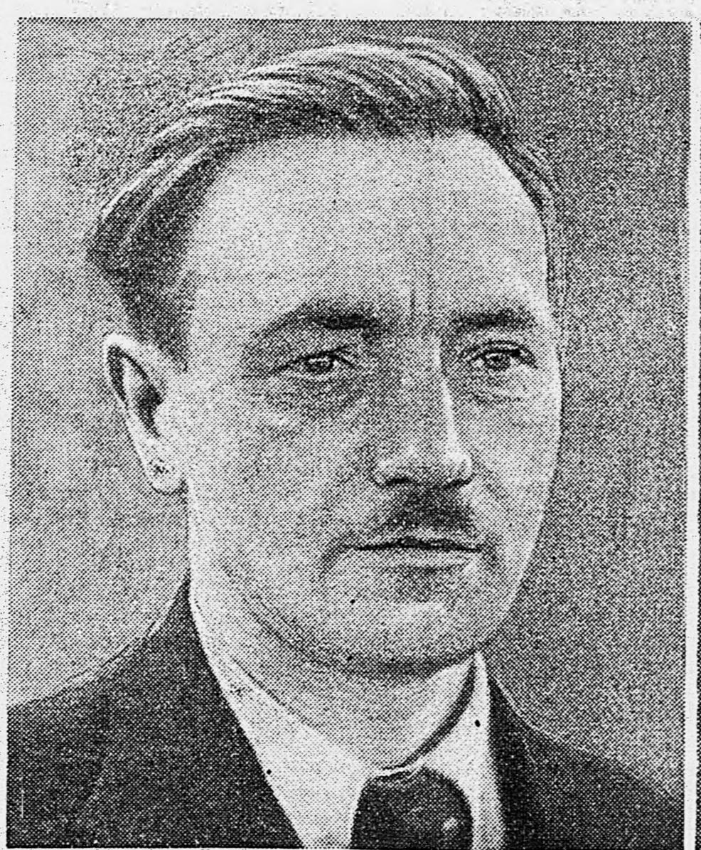
Председатель Крайовой Рады Народовой (Польского Национального Совета) г-н Б. Берут.