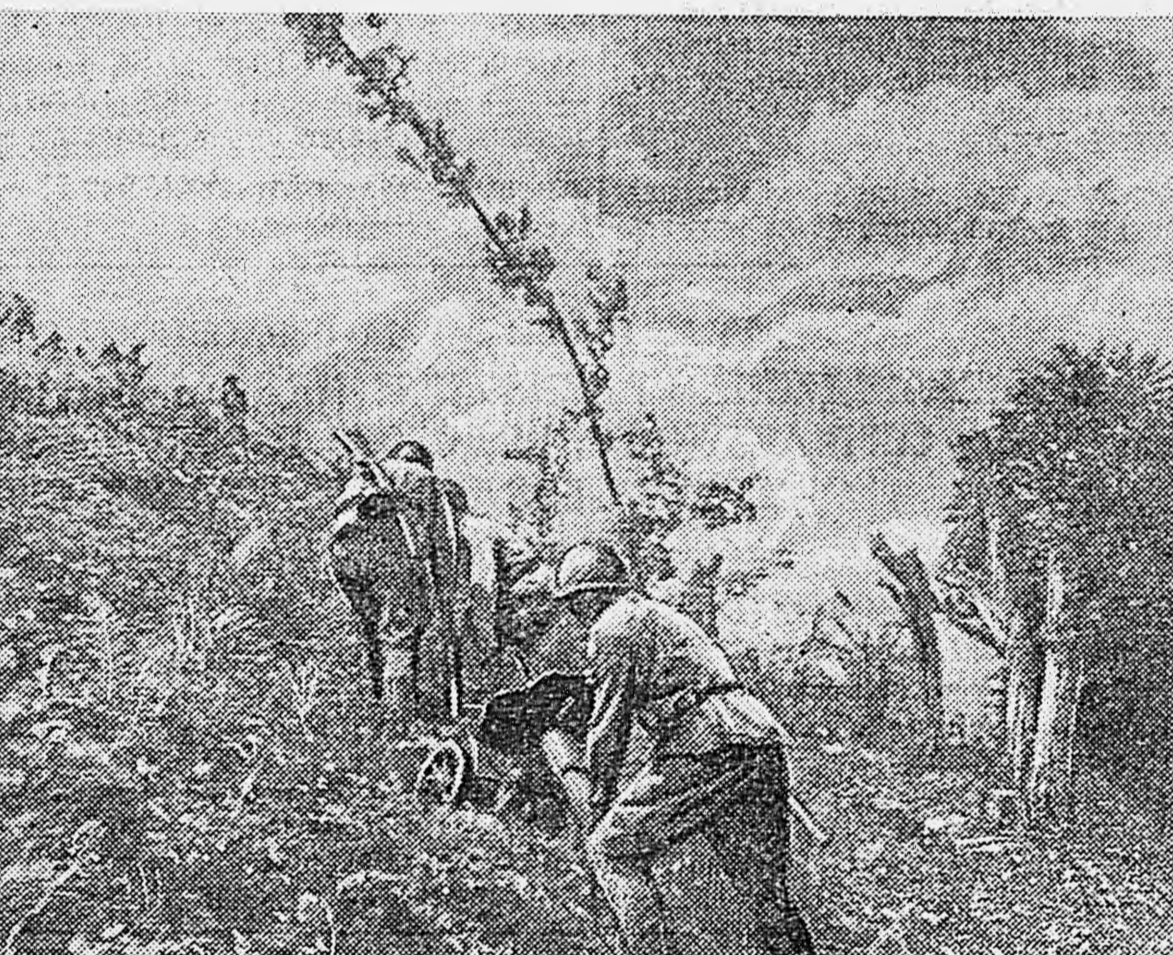
В КАРПАТАХ. Расчет станкового пулемета выдвигается на огневую позицию.