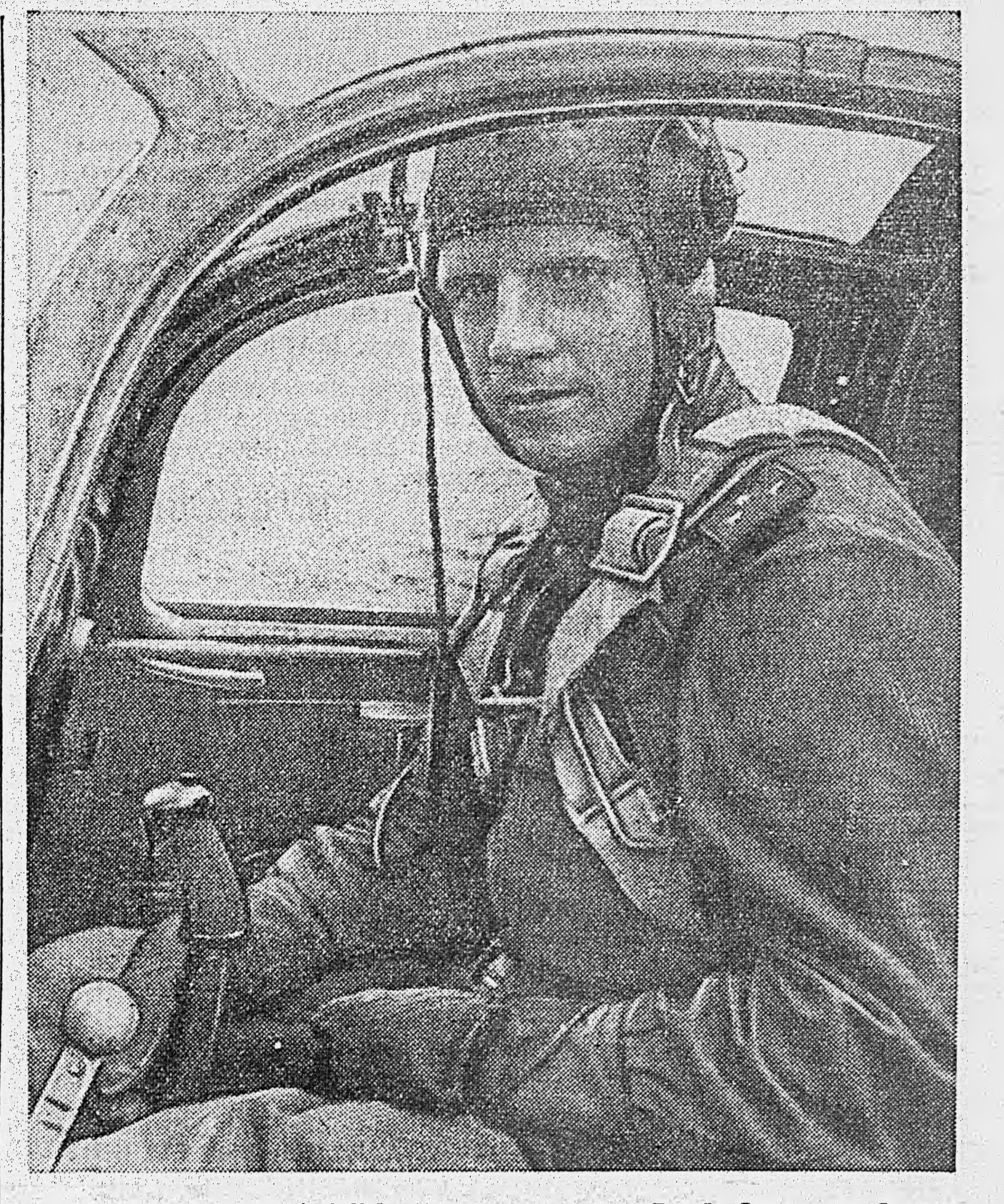
ДЕЙСТВУЮЩАЯ АРМИЯ. Летчик-истребитель Герой Советского Союза гвардии капитан А. Ф. Клаубов, сбивший в воздушных боях под Яссами в течение четырех дней 13 самолетов противника.

Председатель Президиума Верховного Совета СССР М. КАЛИНИН. Секретарь Президиума Верховного Совета СССР А. ГОРКИН. Москва, Кремль, 14 июня 1944 г.