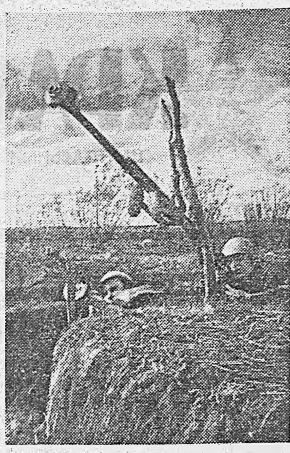
ДЕЙСТВУЮЩАЯ АРМИЯ. Из противотанкового ружья по самолету противника.

Артиллерия широкого применяла выдвигание одного-двух орудий в сторону от основной позиции батареи. Эти орудия немедленно заставляли огневой бой с атакующими танками, отвлекая на себя внимание их экипажей. Танки поворачивали на стреляющие орудия и подстав-