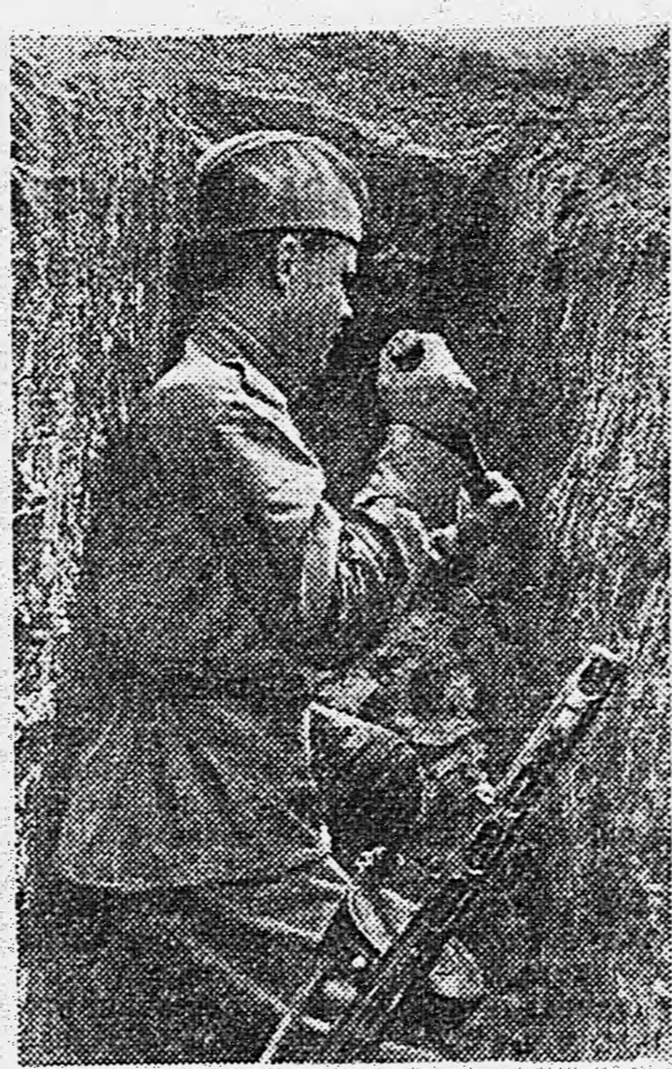
2-й УКРАИНСКИЙ ФРОНТ. За открытой траншеей.

За два года работы коллектив художественной самодеятельности завоевал большую популярность среди бойцов и офицеров своей дивизии, а также соседних частей, в которых он часто выступал.