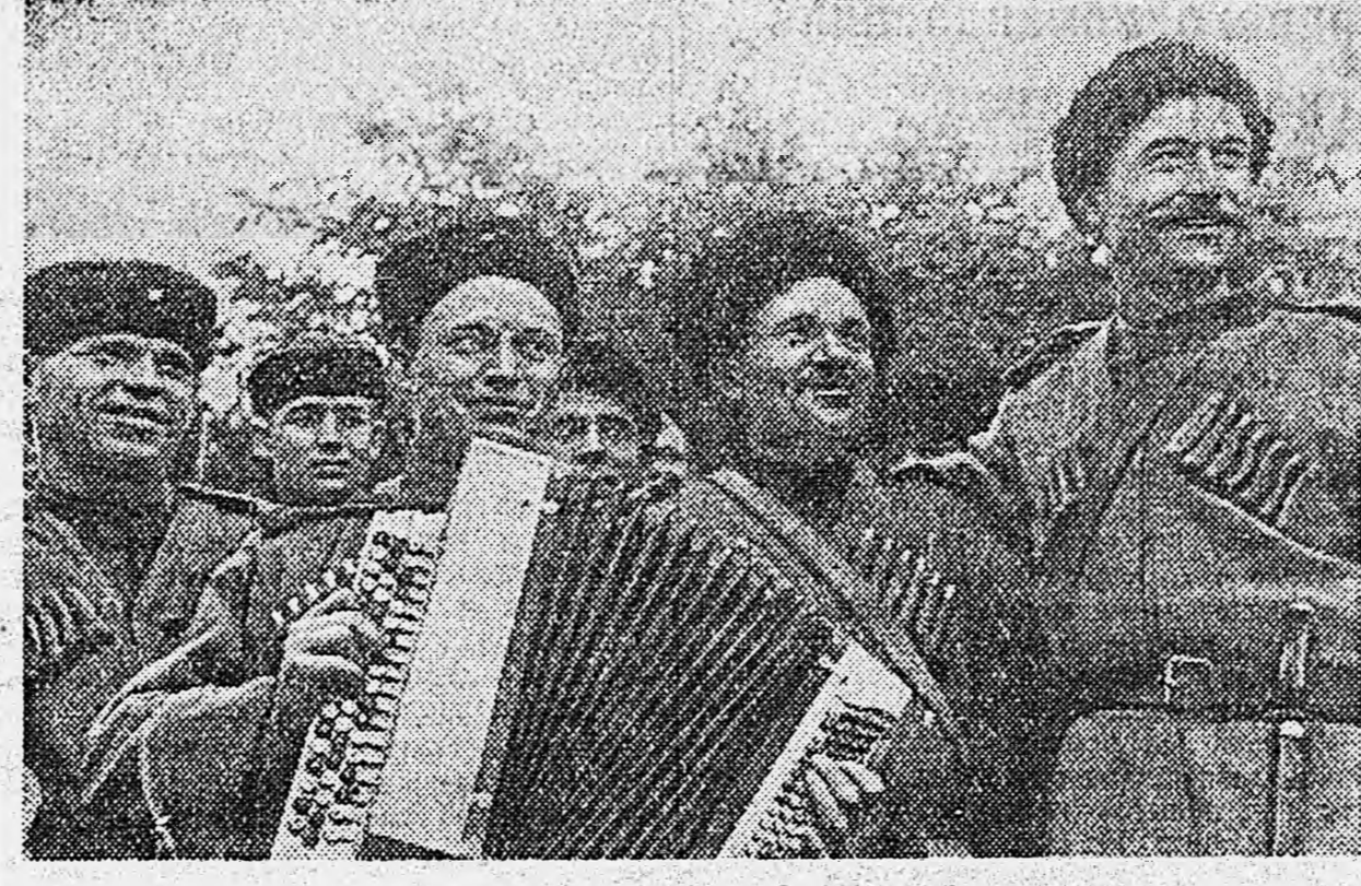
ДЕЯТЕЛЬНАЯ АРМИЯ. Казаки на отдыхе.

ЛОНДОН, 7 июня. (ТАСС). Штаб командования войск союзников в Юго-Восточной Азии сообщает, что японские войска быстро отступают от района Кохики (Манипура).