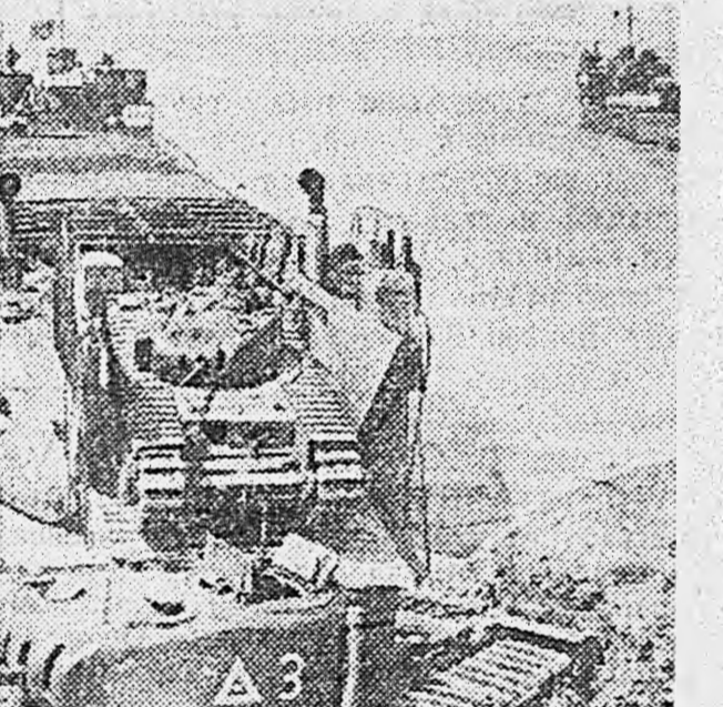
Рис. 2. Тяжелые танки «Черчилль» выгружаются с танконосца.