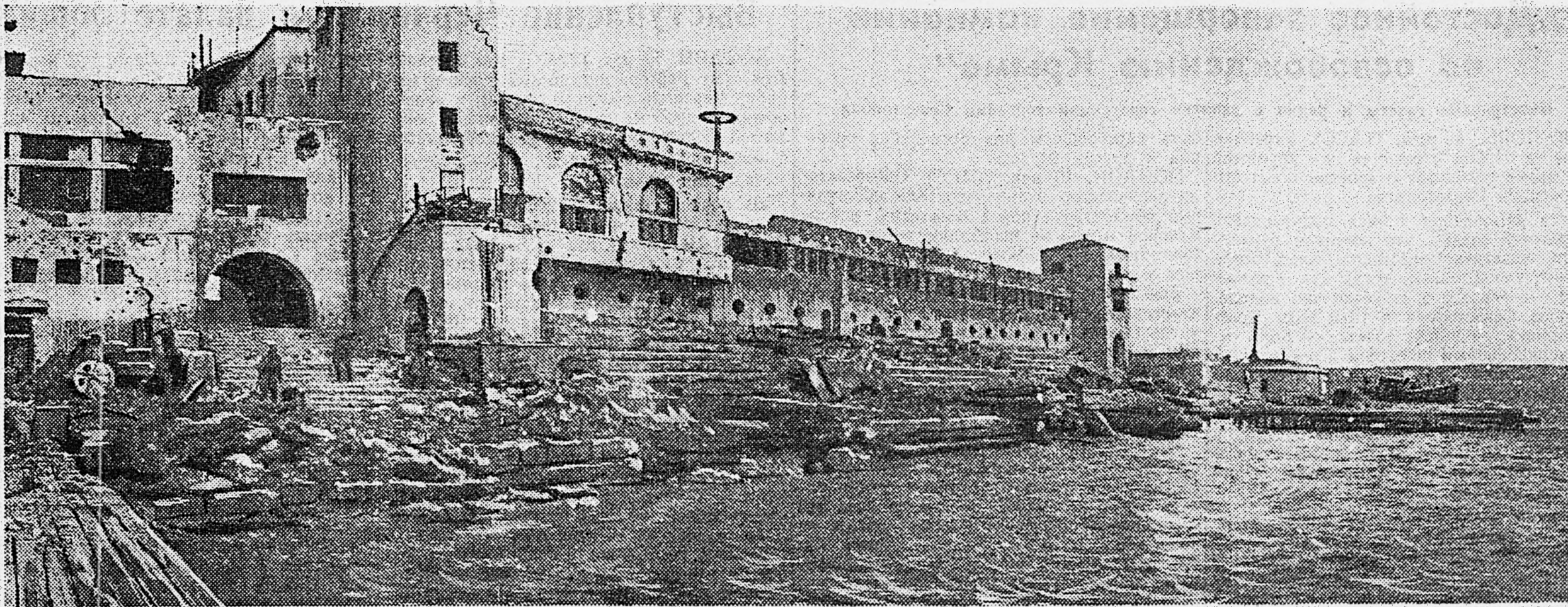
СЕВАСТОПОЛЬ. 1. В Южной бухте. 2. Брошенная немцами техника в районе вокзала.