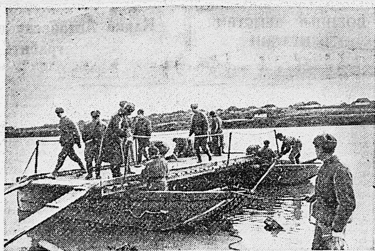
1-й УКРАИНСКИЙ ФРОНТ. Наводка переправы.