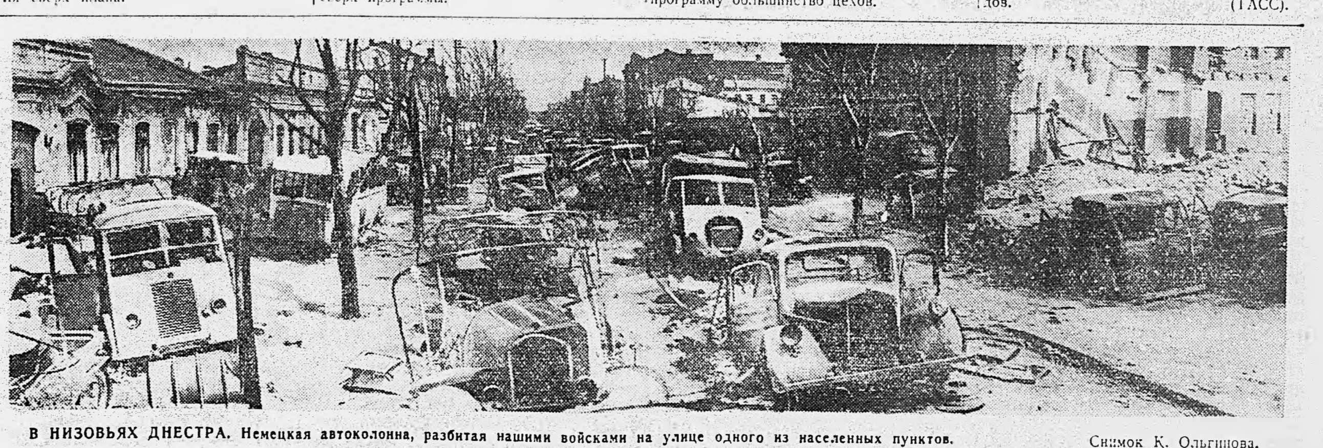
В НИЗОВЬЯХ ДНЕСТРА. Немецкая автоколонна, разбитая нашими войсками на улице одного из населенных пунктов.