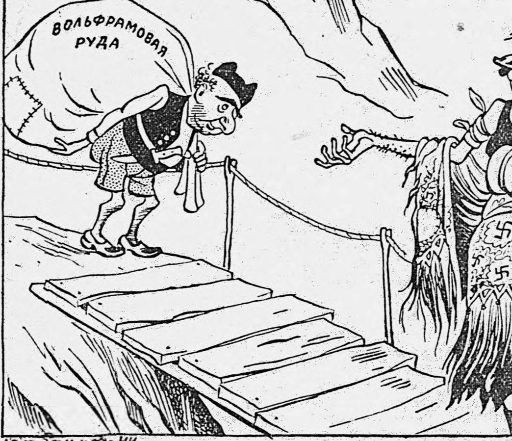
Новая постановка оперы «Кармен». «Сцена в горах». Роли исполняют: Хозе — ФРАНКО, Кармен — ГИТЛЕР.

Рис. Бор. Ефимова. Как сообщает иностранная печать, продолжают поставку вольфрама контрабандным путем из Испании в Германию.