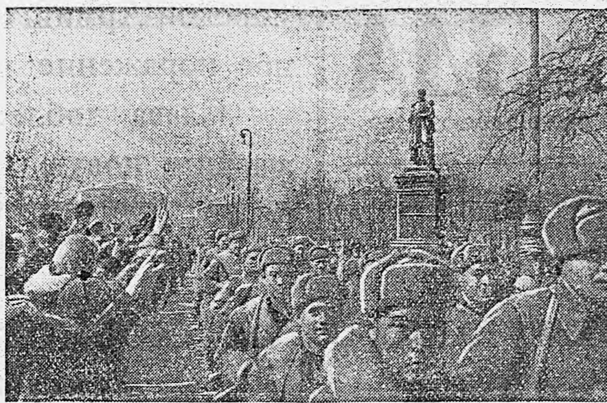
В освобожденной Одессе. На снимках: 1. Население города радостно приветствует своих освободителей. 2. Приморская лестница.