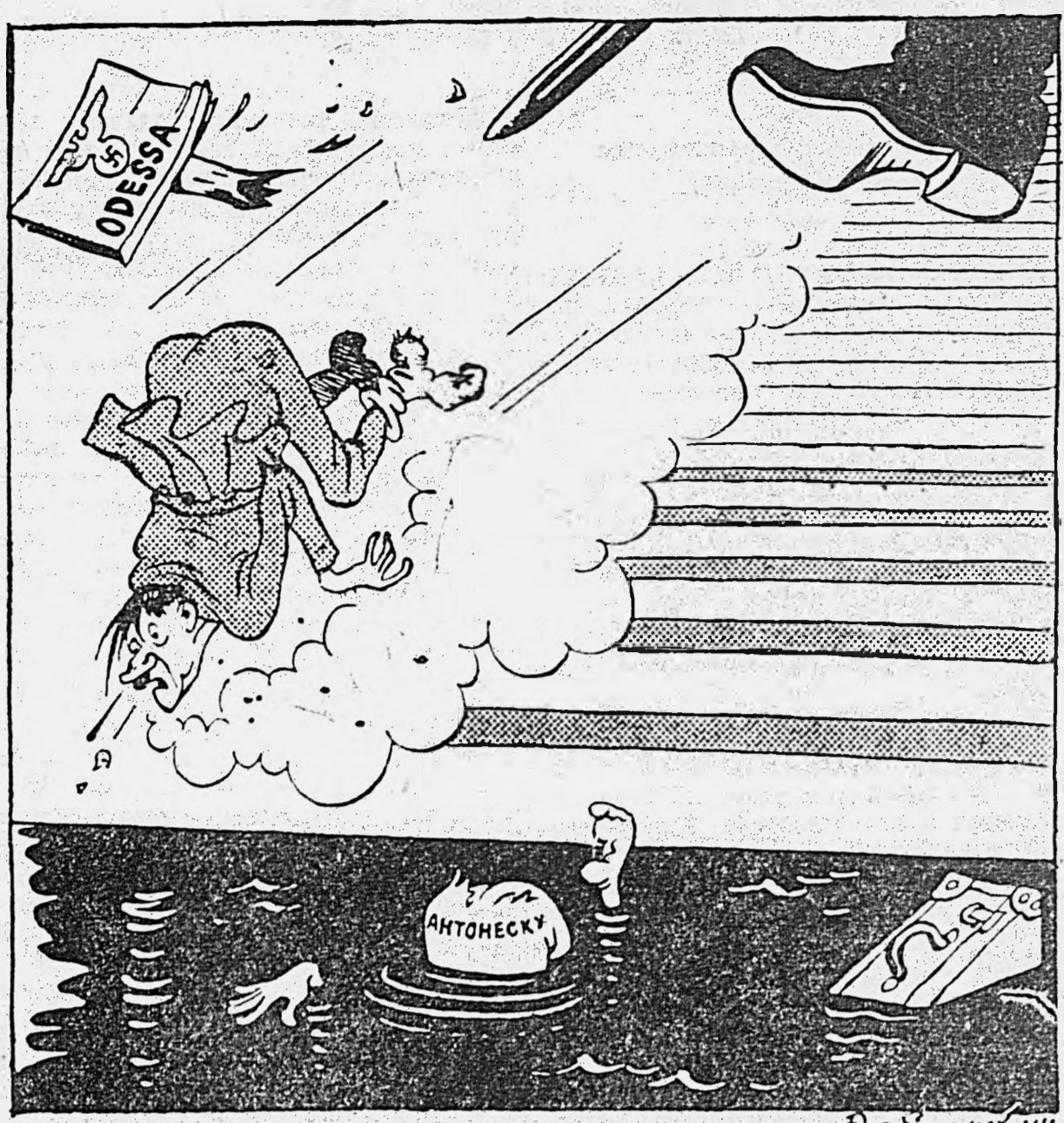
Спуск к морю.