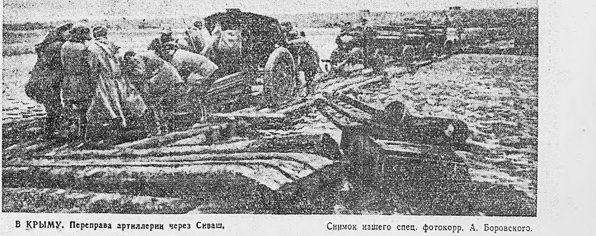
В КРЫМУ. Переправа артиллерии через Сиваш.

— Ты что пытнишь-кряпнишь так, Федя? — Да вот... Ух, ч-ч-ор-р-!.. Поймай медведя! — Медведь большой ли? — Кружный, да! С корыто жиру обещает! — Ну, волоку ж его сюда! — Дык он меня не отпущает! Захват врага в кольцо — классический прием, И усиление к нему мы сохраним, Так: мы — открыто признаем — В борьбе с фашистским вороном Его охотно применяем. По существу прием какой? Охват и — трепещи душа в немецкой теле! Прием — нет спору, он не нов, Но до чего ж хорош на деле!