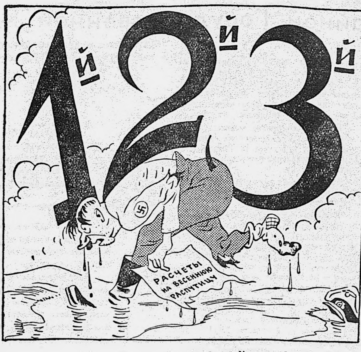
1-й Украинский, 2-й Украинский, 3-й Украинский...