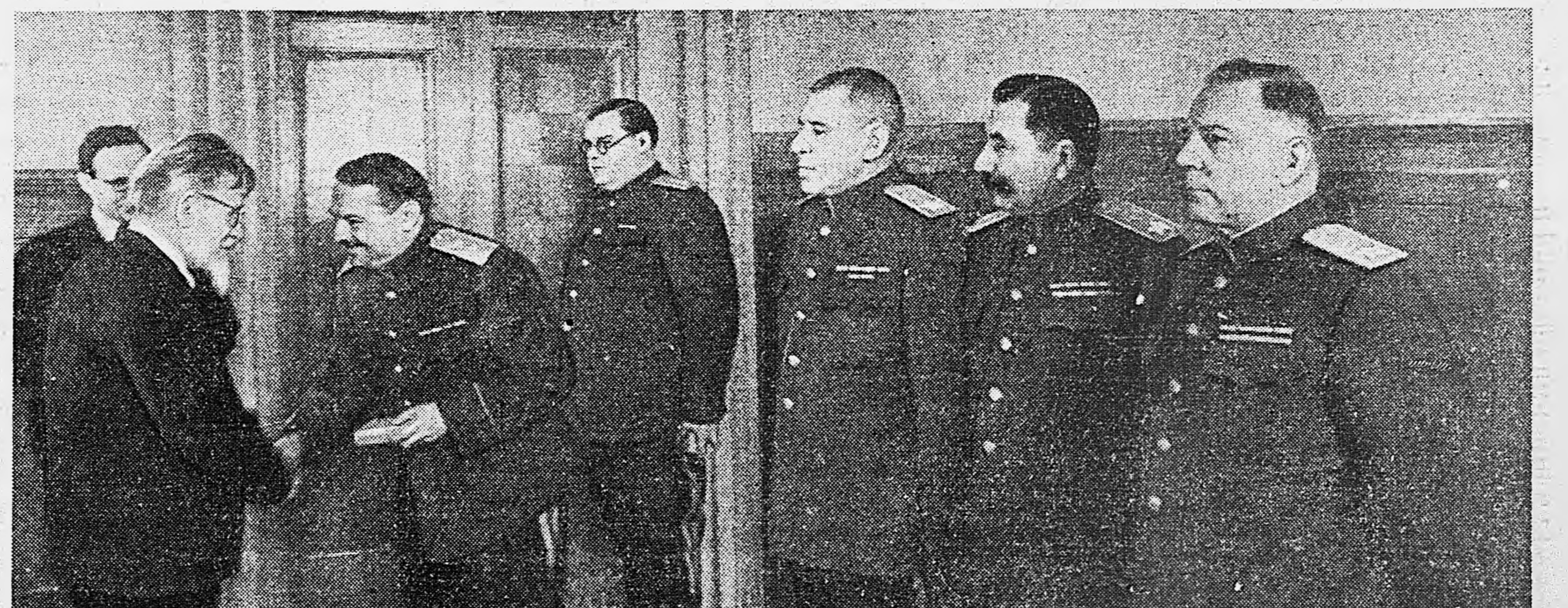
Вручение орденов Суворова I степени маршалам Советского Союза С. М. Буденному, К. Е. Ворошилову, Б. М. Шапошникову, генерал-полковнику А. С. Щербакову и генерал-лейтенанту А. А. Жданову. На снимке: тов. М. И. Калинин вручает орден тов. А. А. Жданову.