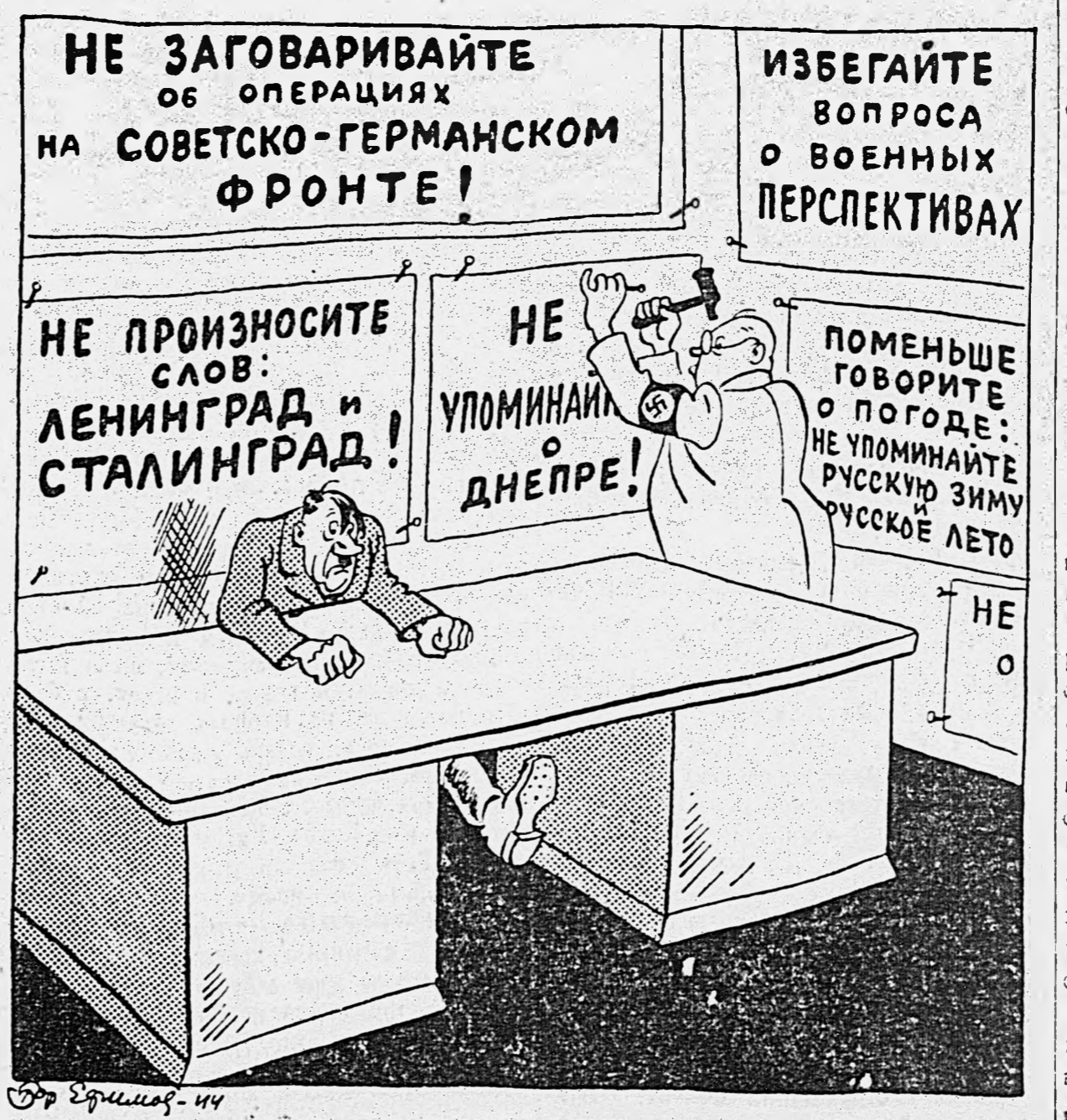
Доктор Моррель принимает меры, чтобы создать спокойную обстановку для своего легко возбудяющегося пациента.

Германское радио сообщило на днях о награждении лейб-медика Гитлера — Морреля. В сообщении особенно подчеркивались способности Морреля «успокаивать легко возбудимых пациентов».