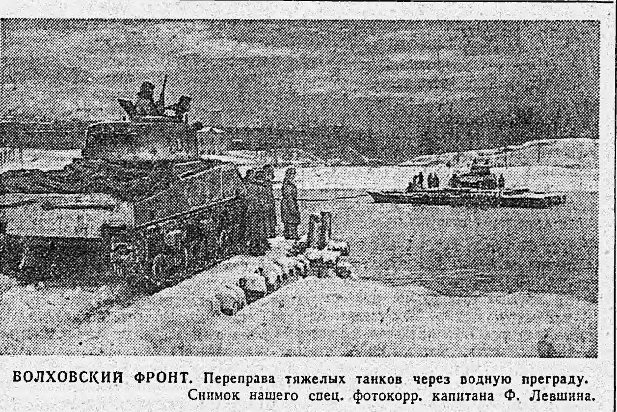
ВОЛХОВСКИЙ ФРОНТ. Переправа тяжелых танков через водную преграду.