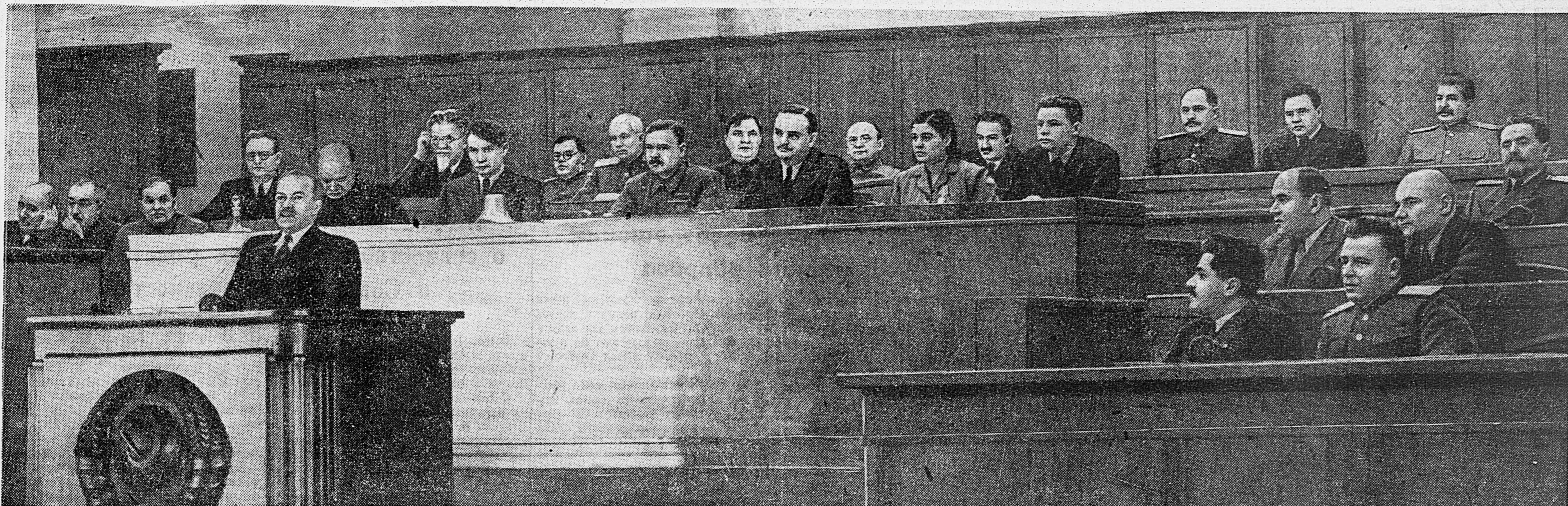
Х сессия Верховного Совета СССР. На совместном заседании Совета Союза и Совета Национальностей 1 февраля. Тов. В. М. Молотов выступает с докладом о преобразовании Наркомата Оборны и Наркоминдела из общесоюзных в союзно-республиканские наркоматы.

заседании Совета Союза и Совета Национальностей 1 февраля 1944 года (1—2 стр.). Генерал-майор Н. Таленский. — Великая битва (3 стр.). Илья Эренбург. — Веса истории (3 стр.). Майор И. Гаглов. — Наши войска овладели городом Кингисепп (4 стр.). Майор Бришь. — Судьба испанского легиона гитлеровцев (4 стр.).