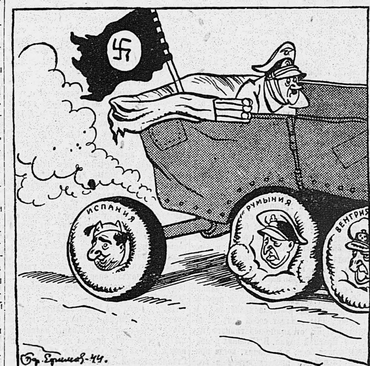
ФРАНКО. — Я держусь абсолютно на стороне от Германии.