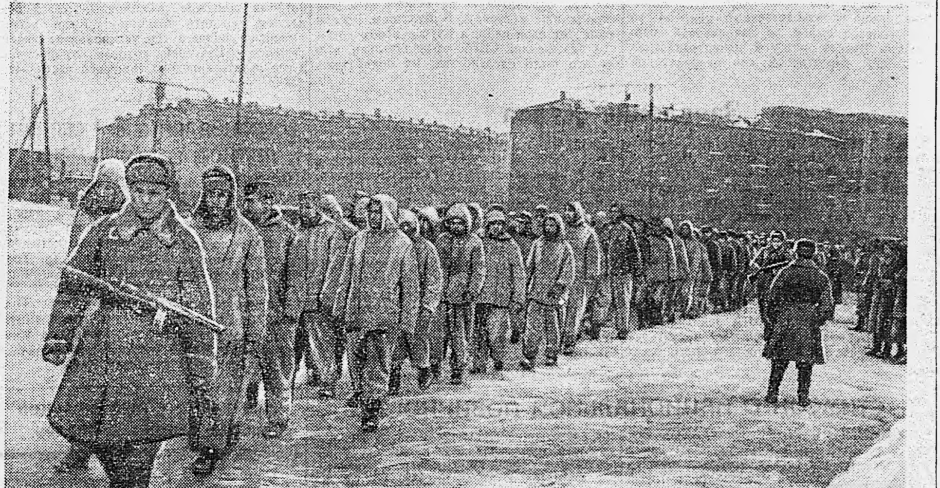
ЛЕНИНГРАДСКИЙ ФРОНТ. Немецкие солдаты, взятые в плен нашими частями.