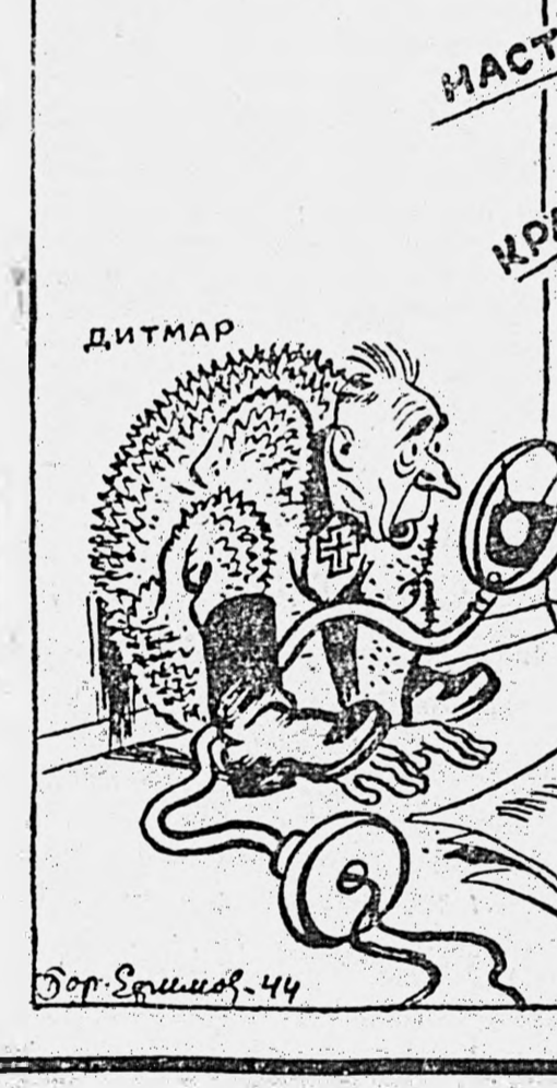
Рис Бор Ефимова.

Фашистский «радиогенерал» Дитмар отход германской армии назвал «процессом сгнивания».