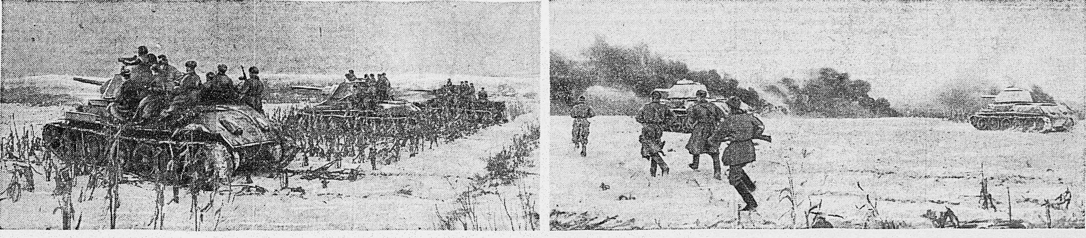
2-й УКРАИНСКИЙ ФРОНТ. 1. Танки с десантом автоматчиков на исходном рубеже для атаки. 2. Пехота и танки идут в атаку.