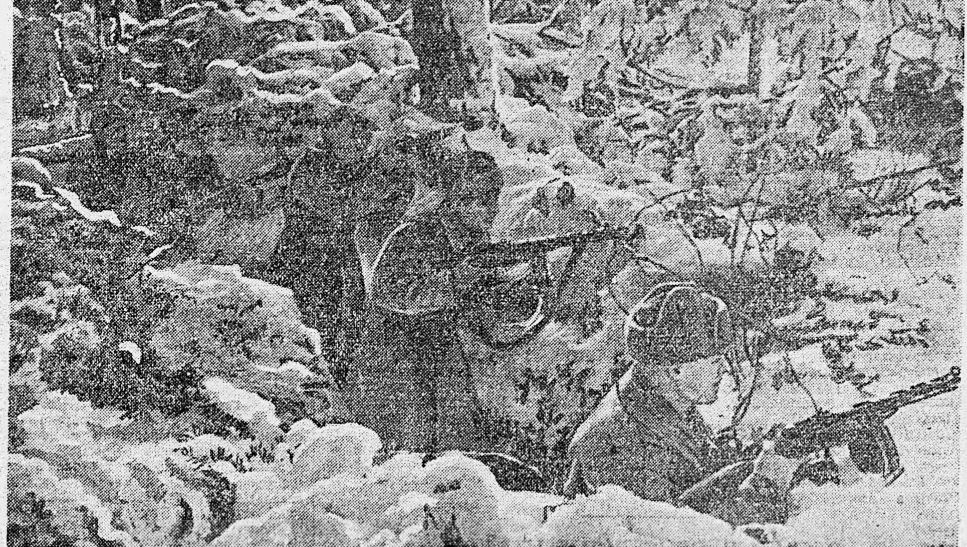
1-й УКРАИНСКИЙ ФРОНТ. Автоматчики ведут бой в лесу.