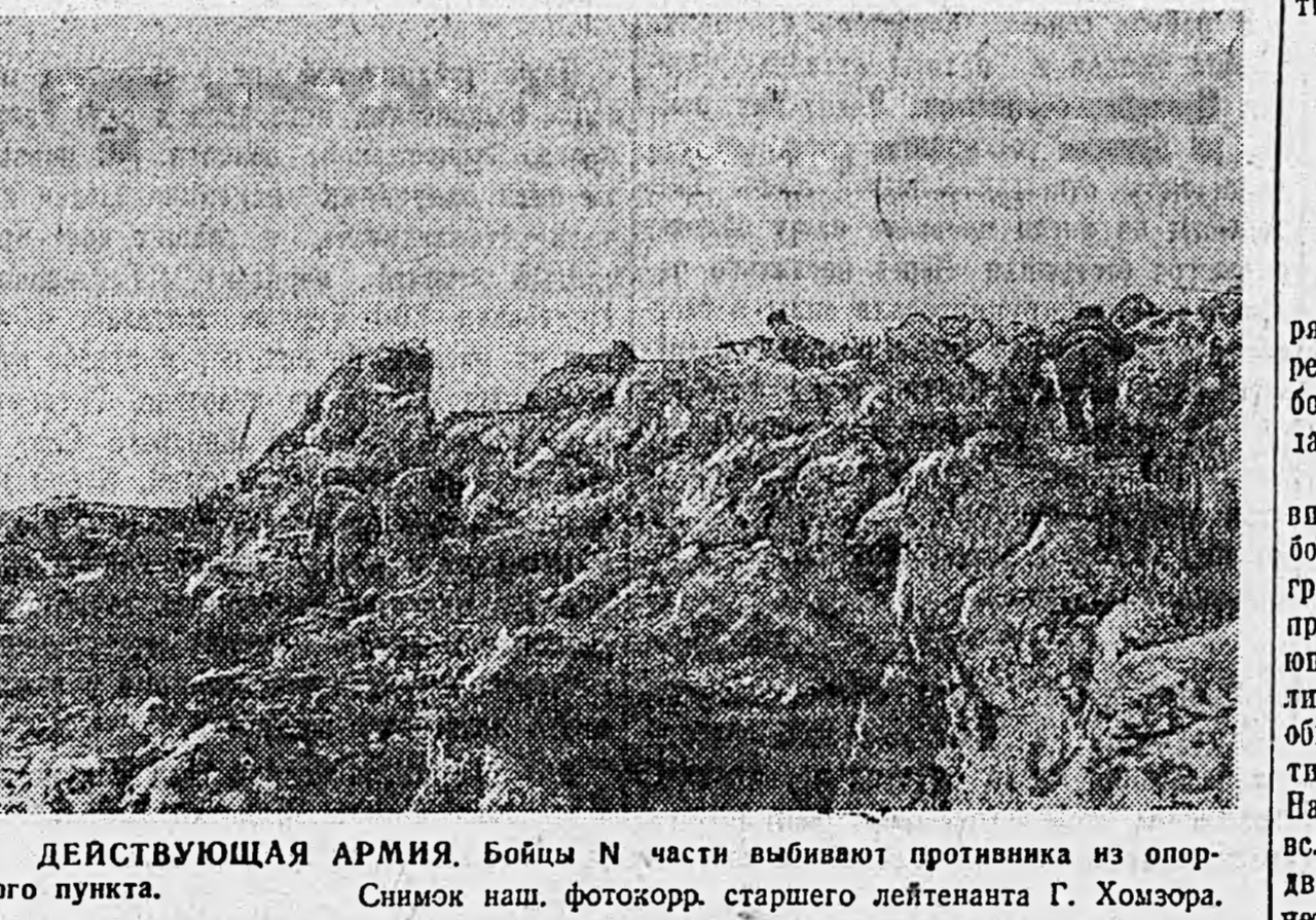
ДЕЙСТВУЮЩАЯ АРМИЯ. Бойцы N части выбивают противника из опорного пункта.