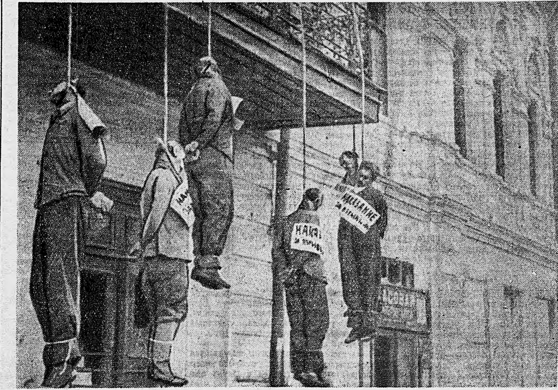
ЗВЕРСТВА НЕМЕЦКО-ФАШИСТСКИХ ЗАХВАТЧИКОВ В Г. ХАРЬКОВЕ И ХАРЬКОВСКОЙ ОБЛАСТИ. Трупы советских граждан, повешенных гитлеровцами на одной из площадей Харькова.