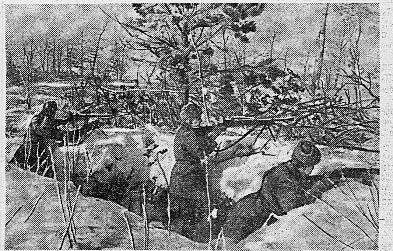
1-й УКРАИНСКИЙ ФРОНТ, 1. Зенитники отражают налет самолетов противника, 2. На переднем крае.